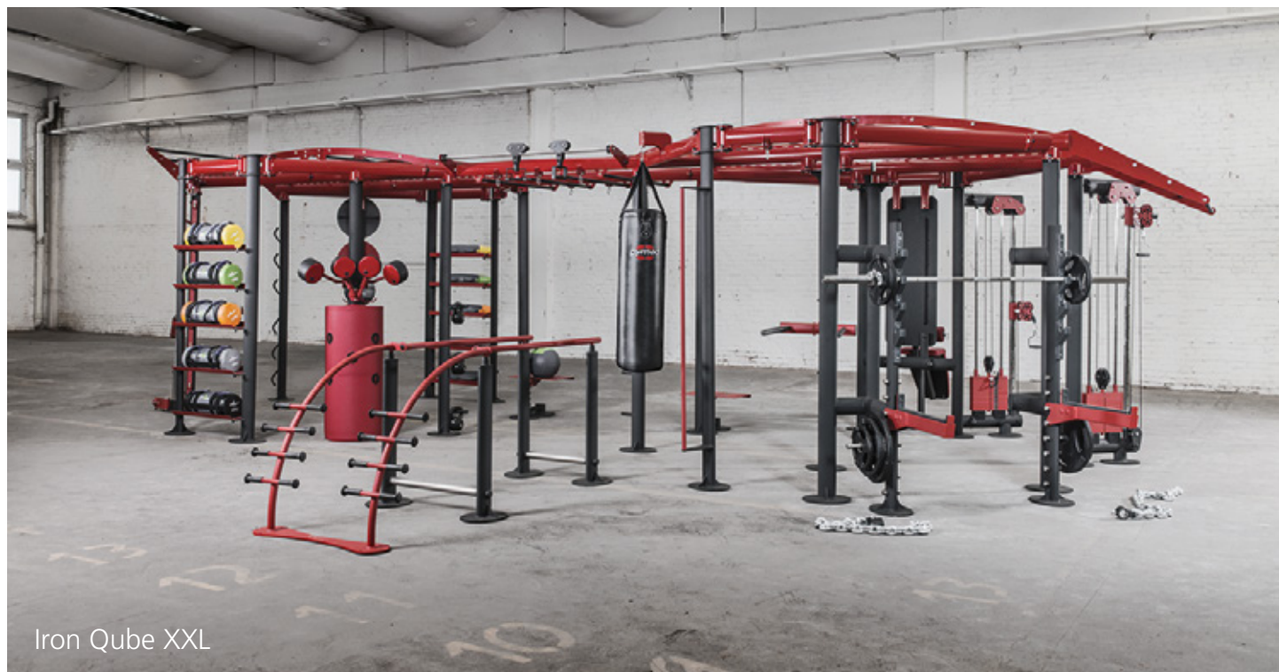
Iron Qube XXL

Star des funktionellen Athletic Performance-Bereiches ist der Iron Qube in seiner XXL Version, eine multifunktionale Trainingsstation, die bis zu vierundzwanzig Trainierenden ein zeitgleiches funktionales Training ermöglicht. Weiteres Highlight des gym80 FIBO-Performance-Bereichs ist der Glute Builder, der auf nur 2 m 2 5 Trainingsstationen in einer vereint. Hier ist der Name Programm: Neben der Funktion als hocheffizienter Gluteus-Trainer, ermöglicht der Glute Builder mehr als 30 verschiedenen Übungen und ist unabdingbar zur Steigerung der athletischen Leistung.