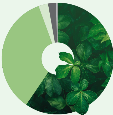
Försäljning / segment 2021

Koncernens långsiktiga mål är att ha en försäljningstillväxt om 20-30 % årligen och via en ökad grad av automatisering och därmed ökad skalbarhet i affären nå en bruttomarginal om över 40 % och en rörelsemarginal (EBIT) om 20 %. Samtidigt ska koncernen bli klimatneutral senast 2023 vilket innebär noll nettoutsläpp av klimatgaser samt att enbart 100 % biobaserade råvaror och förpackningar används.