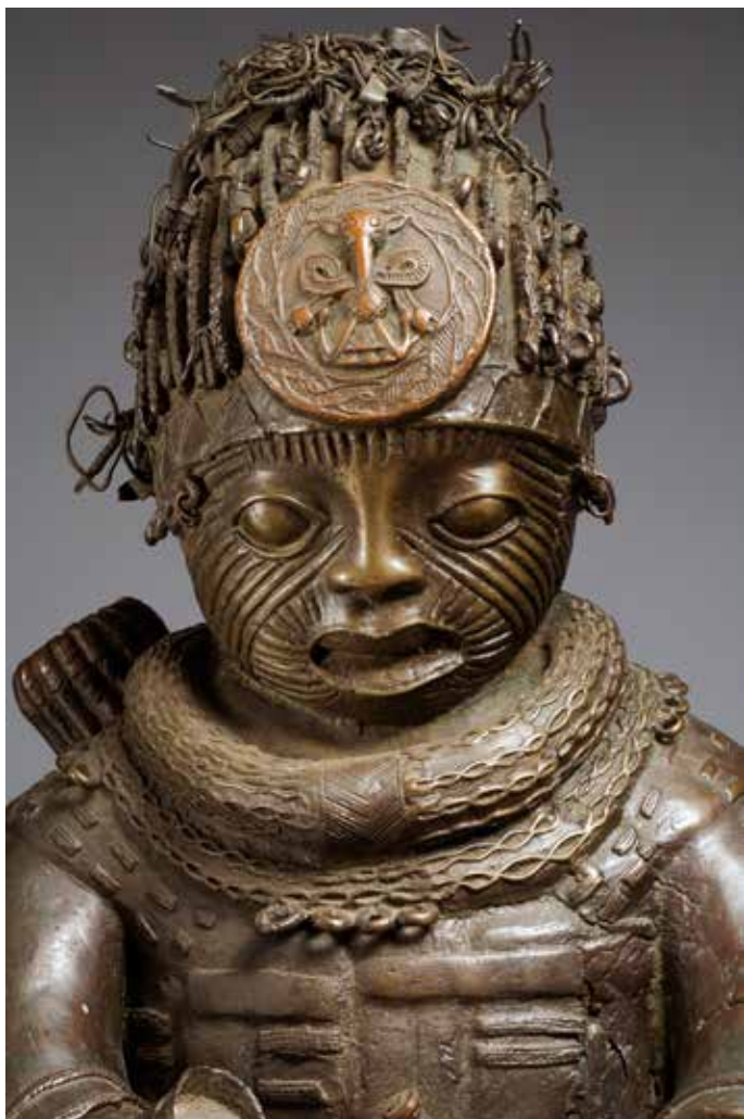
Bowman. Jebba Island. Ca. 1300-tal - 1400-tal e.Kr. Kopparlegering.