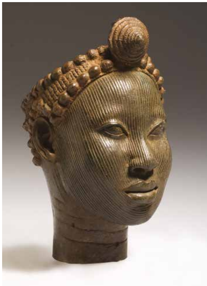
Huvud med krona. Wunmonijie, Ife. 1300-tal - tidigt 1400-tal e.Kr. Kopparlegering.

I direkt anslutning till Afrikanska mästerverk visar vi fotografier av det moderna Ife tagna av Carla De Benedetto. Hon är framförallt känd för sitt fotografi av arkitektur.