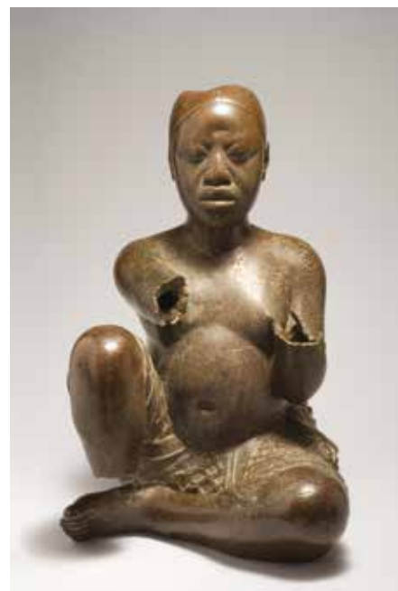
Statyn av en sittande person funnen i Tada, gjuten i koppar någon gång på 1200 - 1300 talet, visar på ett kunnande och en förståelse av människokroppen som får sina motsvarigheter i Europa först genom Donatello och Ghiberti hundra år senare.

Biljetter och visningar för grupper bokas på bergrummet@varldskulturmuseerna.se och telefon 010-456 12 80.