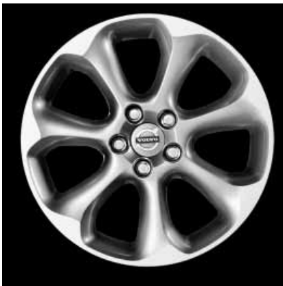
Pontos Silber Stone mit Diamantschliff 7,0 x 17"

1) Nur in Verbindung mit Außenfarbe Ocean Blau-Metallic 2) Nur in Verbindung mit Außenfarbe Electric Silber-Metallic