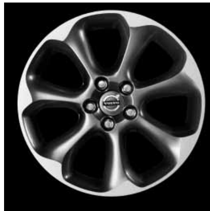
Pontos Hellgrau mit Diamantschliff 7,0 x 17"