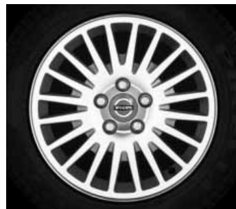
Crius 6,5 x 16"