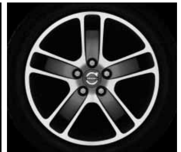
Zaurak Graphit/Silber 7,0 x 17"