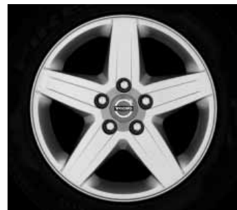
Ceryx 6,5 x 16"