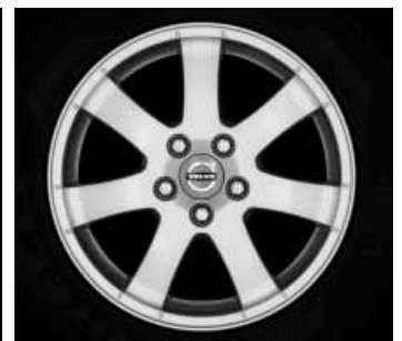
Cordelia 6,5 x 16"