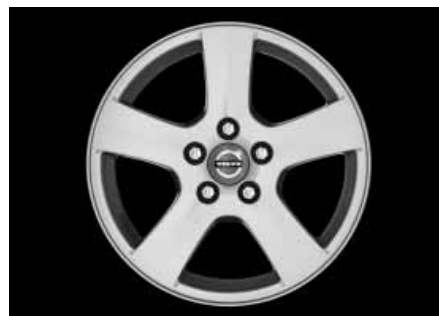
Tania 6,5 x 16"