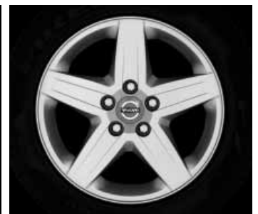
Ceryx 6,5 x 16"