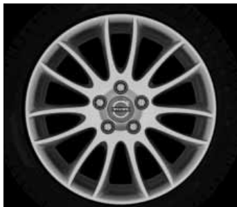
Spartacus 7,0 x 17"