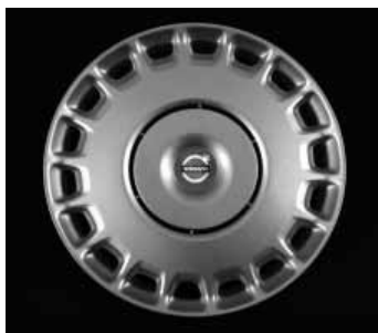
Stahlfelge mit Radzierblende