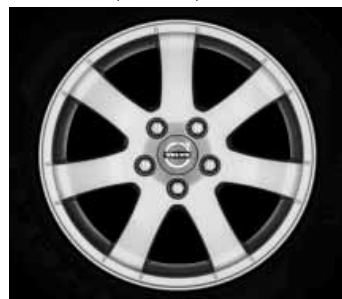
Cordelia 6,5 x 16"