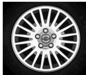
Crius 6,5 x 16"