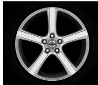
Midir 7,5 x 18"