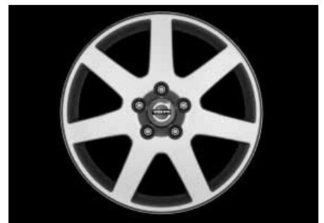
Stylla 7,0 x 17"