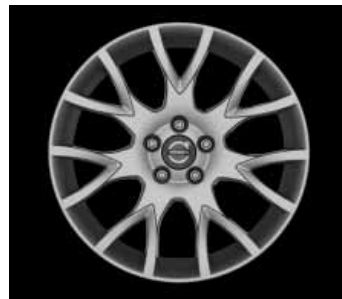
Medusa 7,5 x 18"