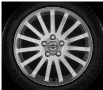
Scotia poliert 7,0 x 17"

1) Nur in Verbindung mit Fahrwerk dynamisch ausgelegt. 2) Nicht in Verbindung mit Sportfahrwerk oder Niveauregulierung.