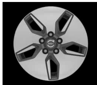
Libra 6,0 x 15"/6,5 x 16"