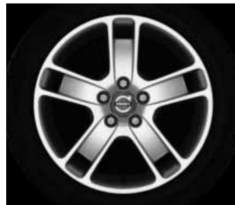
Zaurak 7,0 x 17"