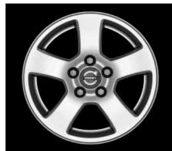
Isis 6,0 x 15"