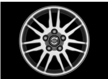
Acrux 6,0 x 15"