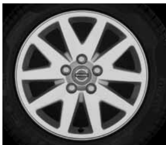
Cursa 6,5 x 16"