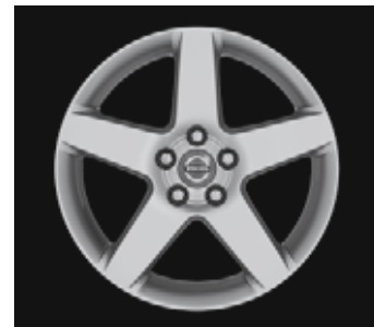
Serapis 7,0 x 17"