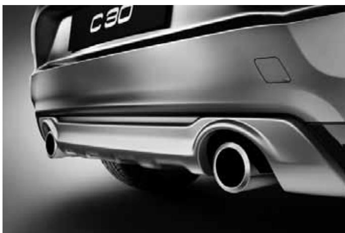
Heckschürzeneinsatz, Aluminium-Optik und Sport-Endrohre (Paar), Edelstahl poliert. Sport-Endrohre nur für Motorisierungen D3, D4 und T5. Nicht in Verbindung mit R-Design. Nicht in Verbindung mit DRIVe Start/Stop.

Die Zubehörteile Frontspoilereinsatz, Dekorrahmen, Schwellerleisten und Heckschürzeneinsatz sind auch erhältlich als komplettes Designpaket mit Preisvorteil.