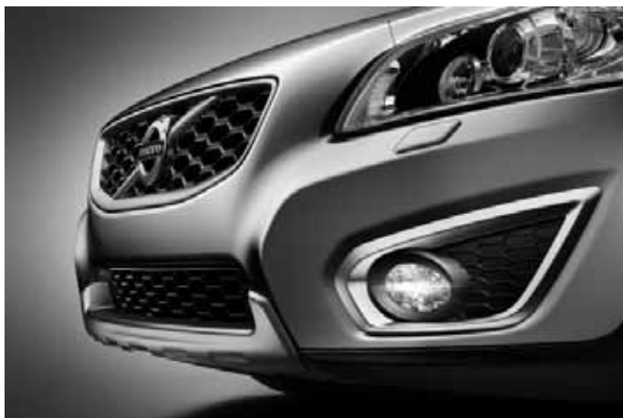
Frontspoilereinsatz und Dekorrahmen vorn (Paar), Aluminium-Optik. Nicht in Verbindung mit R-Design.