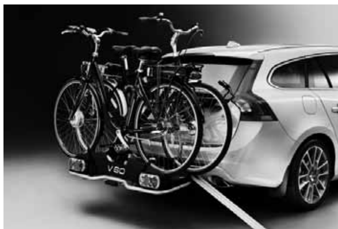
Fahrradträger „E-Bike“ und Laderampe, für Anhängerkupplung. Für bis zu zwei Elektrofahrräder.

Weiteres Zubehör sowie die aktuellen unverbindlichen Preisempfehlungen der Volvo Car Germany GmbH entnehmen Sie bitte den Zubehörpreislisten auf www.volvocars.de