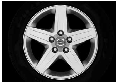
Ceryx 6,5 x 16"