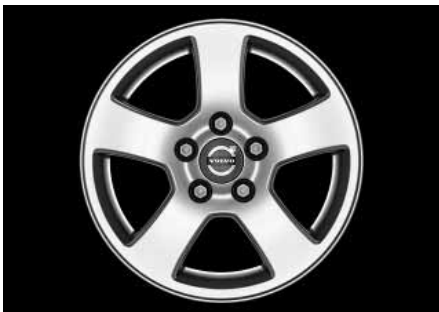
Isis 6,0 x 15"