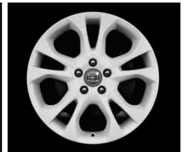
Styx White 7,0 x 17"