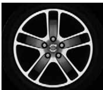
Zaurak Graphit/Silber 7,0 x 17"