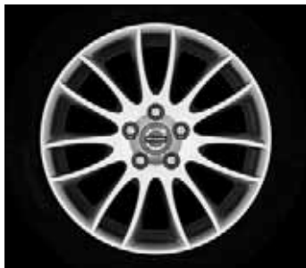
Spartacus 7,0 x 17"

2) Nicht in Verbindung mit Sportfahrwerk.