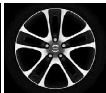
Atreus 7,5 x 18"