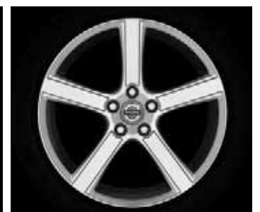
Midir 7,5 x 18"