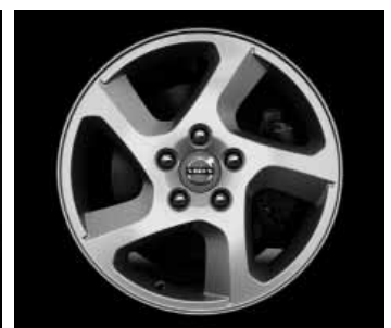
Convector 6,5 x 16"