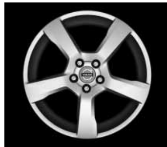
Cratus 7,0 x 17"