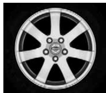
Cordelia 6,5 x 16"