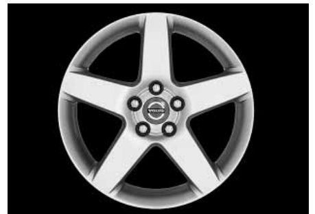
Serapis 7,0 x 17"