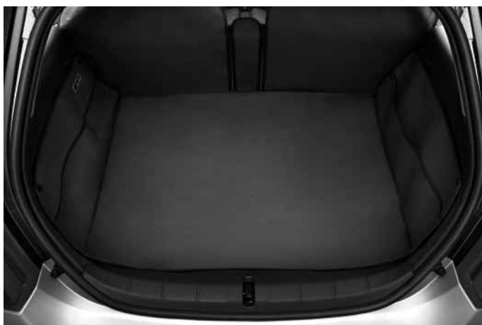
Gepäckraum-Schutzmatte. Vollflächige Abdeckung des Gepäckraumes bis zur Unterkante der Fenster. Integrierte Taschen links und rechts. Robustes und flexibles Vinylmaterial.