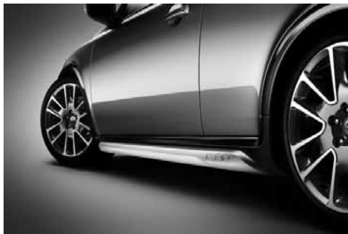
Schwellerleisten (Paar), Aluminium-Optik, mit Schriftzug „C30“. Nicht in Verbindung mit R-Design.