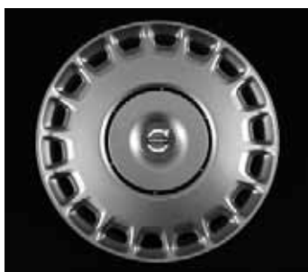
Stahlfelge mit Radzierblende