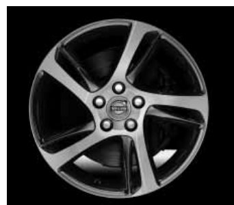
Spider 7,0 x 17"