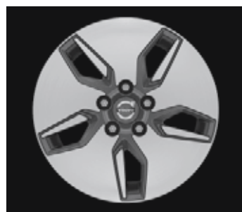
Libra 6,5 x 16"