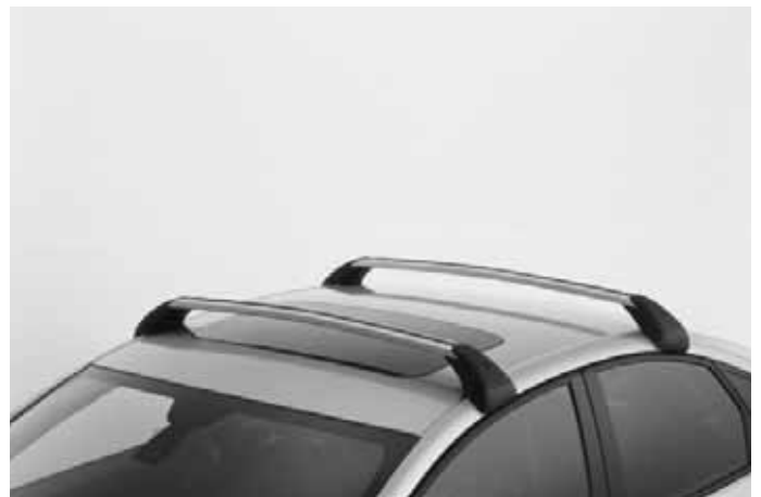
Lastenträger „Highline“. Elegantes Aluminium-Profil mit T-Nut. Kann mit Schlössern ergänzt werden.