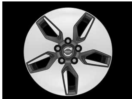
Libra 6,5 x 16"