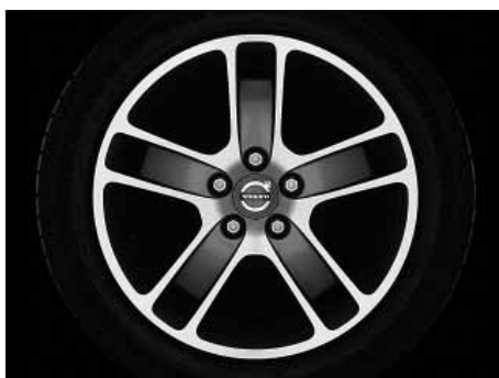
Zaurak Graphit/Silber 7,0 x 17"