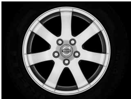
Cordelia 6,5 x 16"