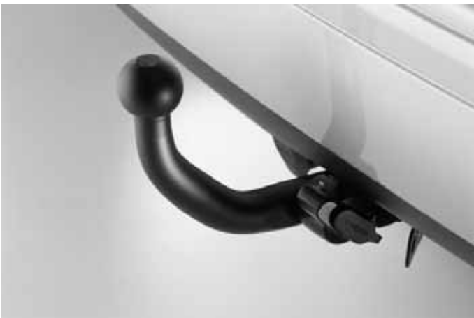
Anhängerkupplung, fest oder abnehmbar.