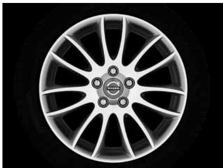
Spartacus 7,0 x 17"