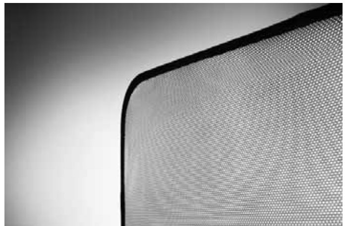
Passform-Sonnenschutzblenden. Für die Hintertüren (Paar) und den Gepäckraum (dreiteiliger Satz) erhältlich.