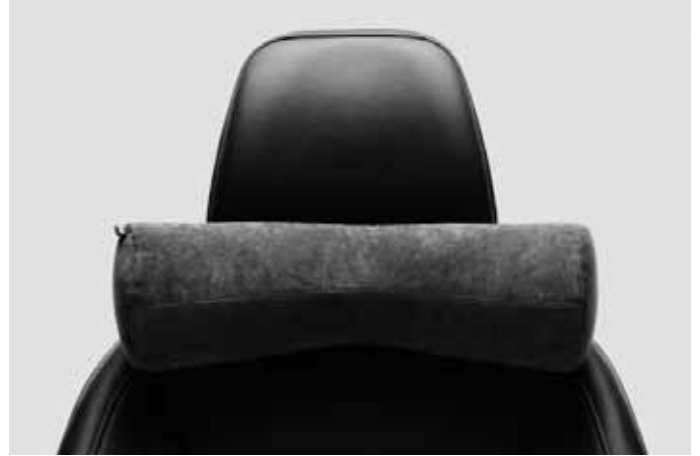
Komfortkissen. Weich gepolstertes Nackenkissen zur Befestigung an jeder Kopfstütze. Bezug abnehmbar und waschbar.