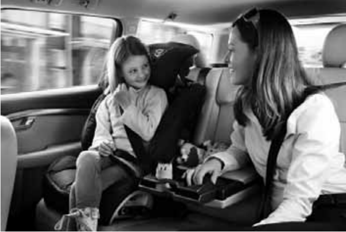
Gurtkissen mit Rückenlehne. Gruppe III, für Kinder von ca. 15 bis 36 kg Körpergewicht. Erfüllt die Normen ECE R44-04 und Öko-Tex Standard 100.