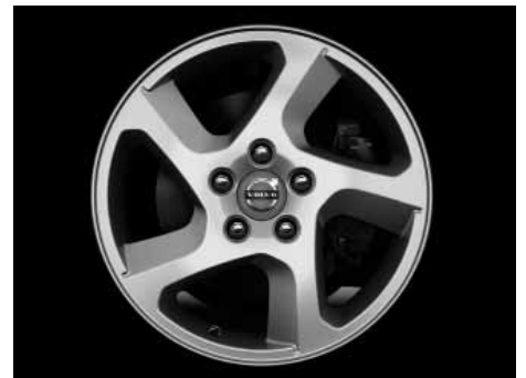
Convector 6,5 x 16"