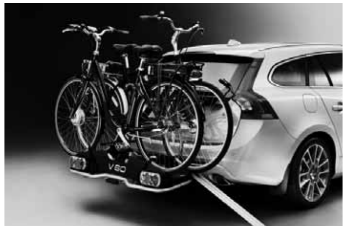
Fahrradträger „E-Bike“ und Laderampe, für Anhängerkupplung. Für bis zu zwei Elektrofahräder.

Weiteres Zubehör sowie die aktuellen unverbindlichen Preisempfehlungen der Volvo Car Germany GmbH entnehmen Sie bitte den Zubehöpreislisen auf www.volvocars.de