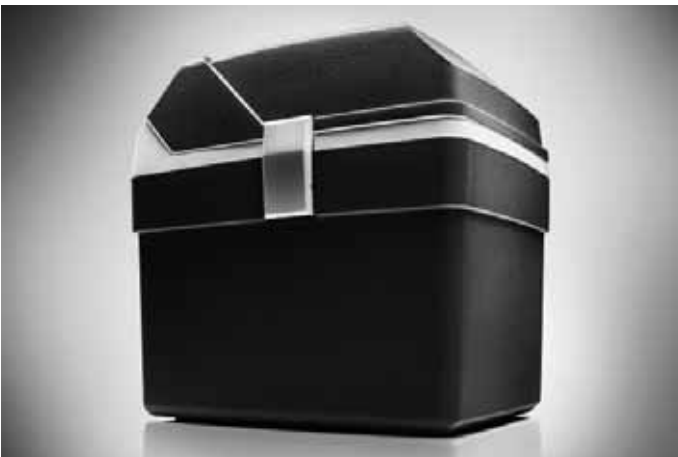
Kühl-/Warmhaltebox, elektrisch. Portabel, 18 Liter Volumen.