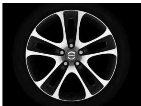
Atreus 7,5 x 18"