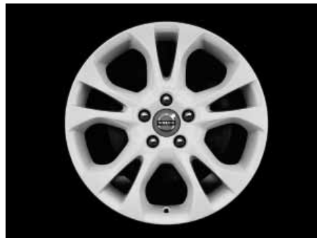
Styx White 7,0 x 17"