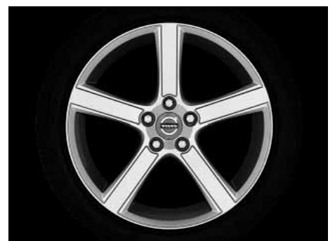
Midir 7,5 x 18"