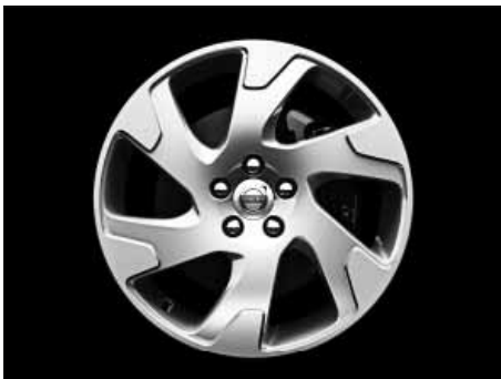
Argus 8,0 x 18"