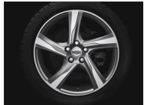
Ixon 8,0 x 18"