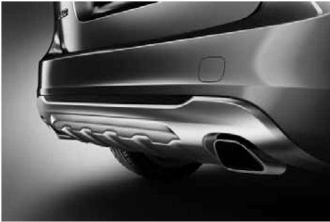
Heckschürzeneinsatz, Aluminium-Optik und Sport-Endrohre, Edelstahl poliert. Für Motorisierung D3 ein Endrohr, für alle anderen Motorisierungen zwei Endrohre.

Die Zubehöre Frontspoilereinsatz, Dekorrahmen, Schwellerleisten und Heckschürzeneinsatz sind auch erhältlich als komplettes Designpaket mit Preisvorteil.