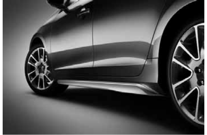
Schwellerleisten (Paar), Aluminium-Optik.