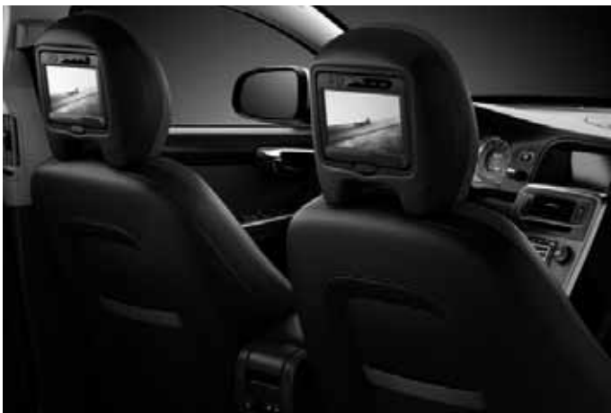
Rear Seat Entertainment (RSE).