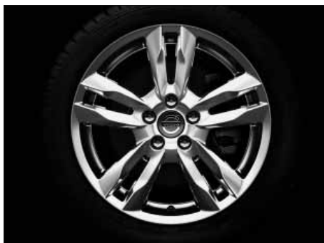
Njord 8,0 x 17"