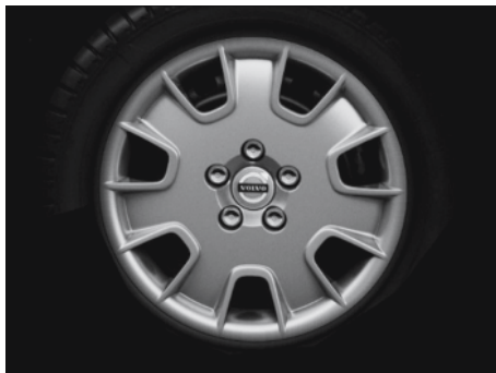
Stahlfelge 7,0 x 16"