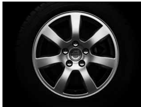
Oden 7,0 x 16"