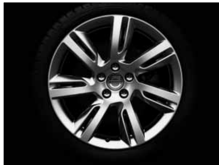
Sleipner 8,0 x 18"