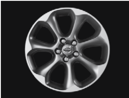
Pontos Diamantschnitt/Hellgrau 7,5 x 17"