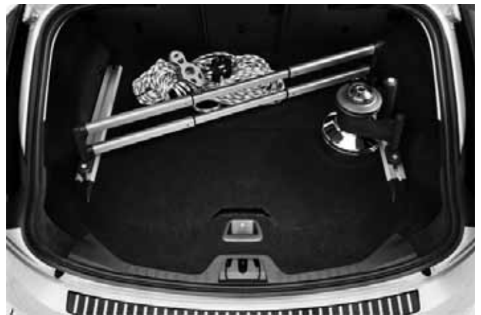
Gepäckraum-Organizer, vierteilig. Zwei Gleitschienen mit Klemmbefestigung, ein Spanngurt sowie eine Teleskop-Doppelstange. Stoßfänger-Schutzfolie, teiltransparent.

Weiteres Zubehör sowie die aktuellen unverbindlichen Preisempfehlungen der Volvo Car Germany GmbH entnehmen Sie bitte den Zubehörlisten auf www.volvocars.de