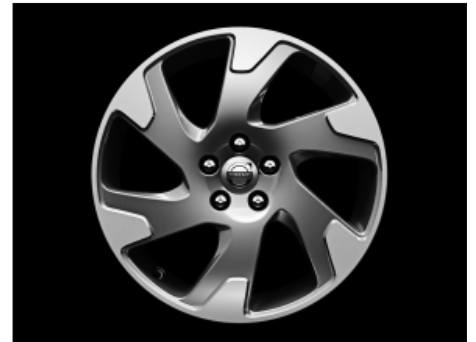
Argus Diamantschnitt/Hellgrau 8,0 x 18"