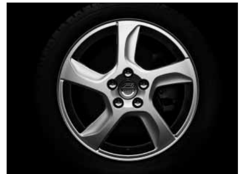
Balder 7,0 x 17"