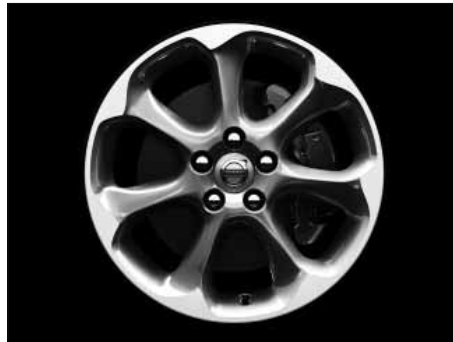
Pontos 7,5 x 17"