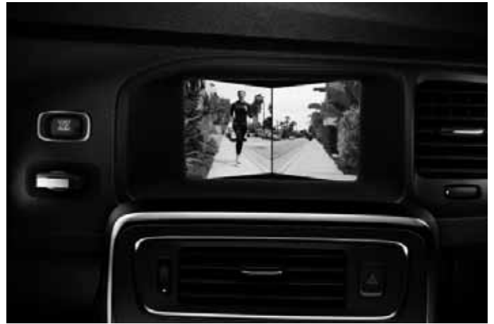
Frontkamera. Nur in Verbindung mit Audiopaket High Performance Multimedia oder Audiopaket Premium Sound Multimedia.

Die Zubehöre Frontspoilereinsatz, Dekorrahmen, Schwellerleisten und Heckschürzeneinsatz sind auch erhältlich als komplettes Designpaket mit Preisvorteil.