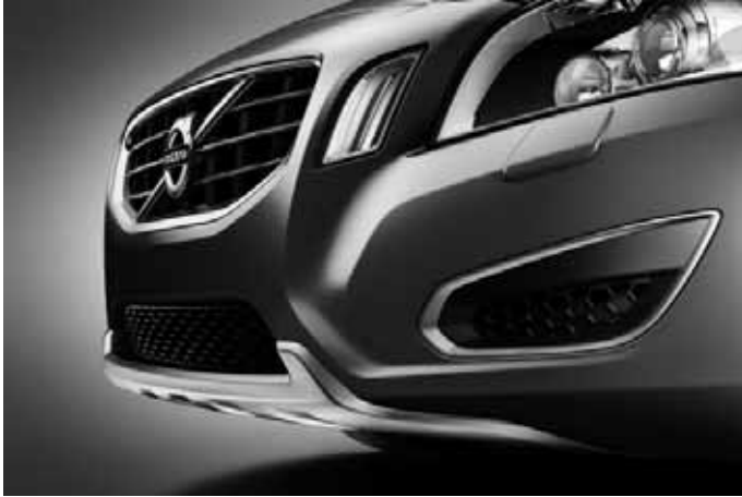
Frontspoilereinsatz und Dekorrahmen vorn (Paar), Aluminium-Optik.