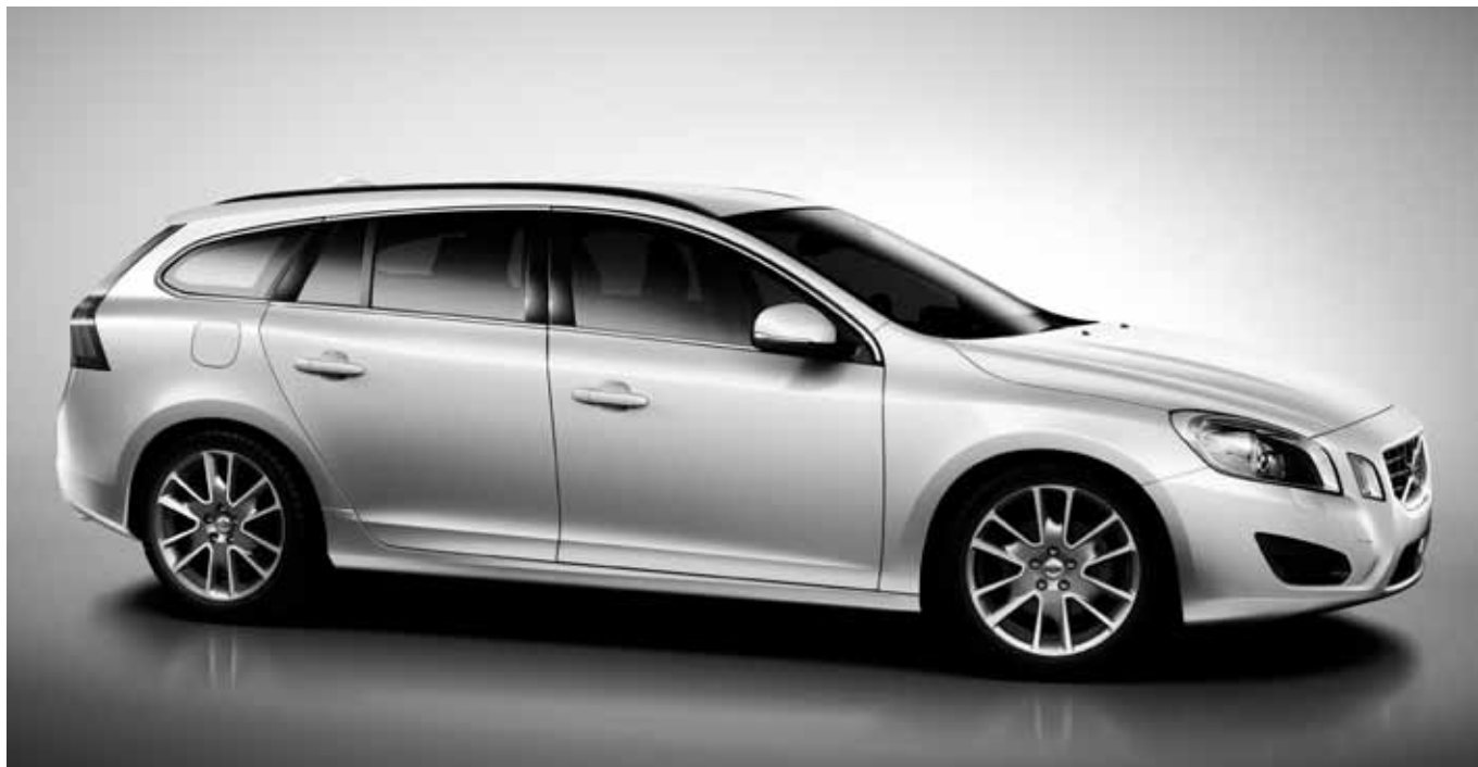
Volvo V60 Edition Pro mit Leichtmetallfelgen „Freja“ Graphitoptik 8,0 x 18".