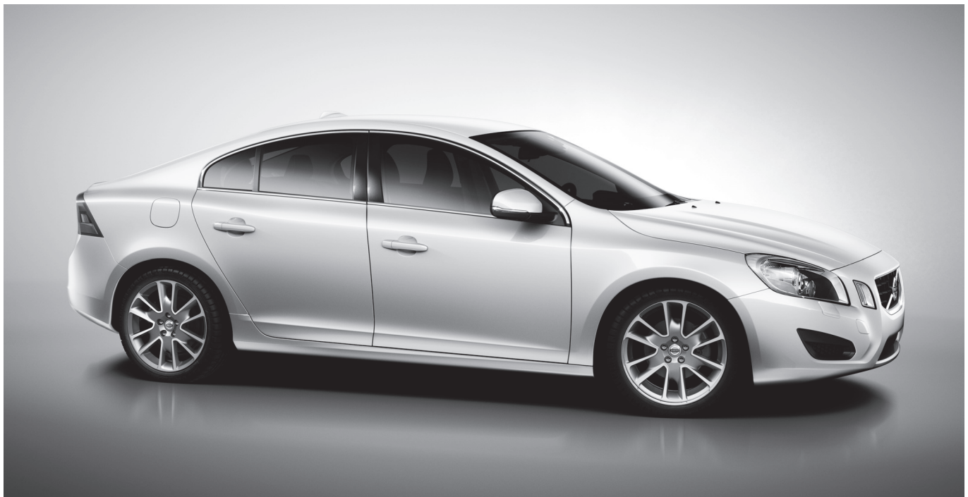
Volvo S60 Edition Pro mit Leichtmetallfelgen „Freja“ Graphitoptik 8,0 x 18".