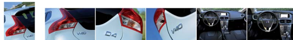
049_Volvo V40 D4.jpg 050_Volvo V40 D4.jpg 051_Volvo V40 D4.jpg 052_Volvo V40 D4.jpg 053_Volvo V40 D4.jpg 054_Volvo V40 D4.jpg