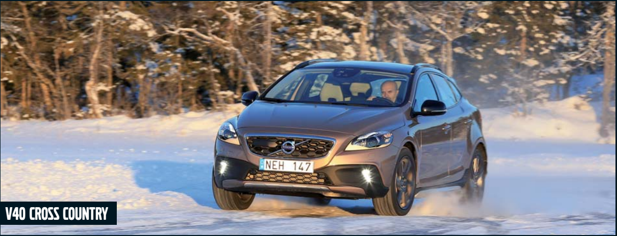
V40 CROSS COUNTRY