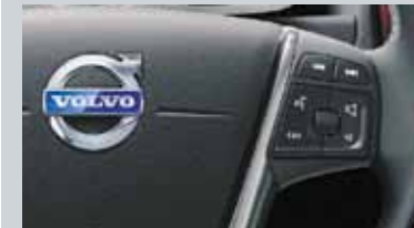
Commande vocale avancée au volant et Connexion Bluetooth®