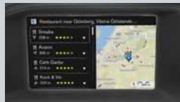
Sensus Connect et Sensus Navigation