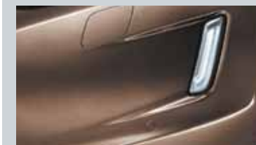
Radars de stationnement avant