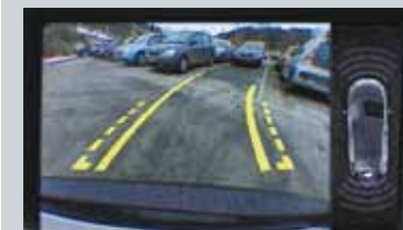
Caméra de recul