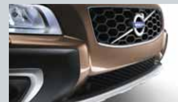
Radar de stationnement avant