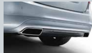
Radars de stationnement arrière