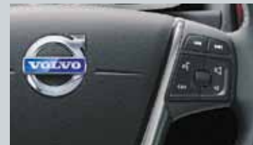
Commande vocale avancée au volant et Connexion Bluetooth®