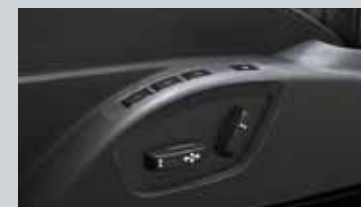
Siège conducteur à réglages électriques