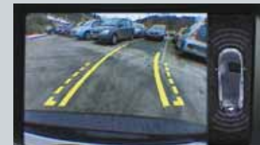
Caméra de recul