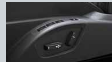
Siège conducteur à réglages électriques