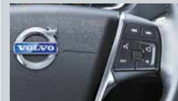
Commande vocale avancée au volant et Connexion Bluetooth®