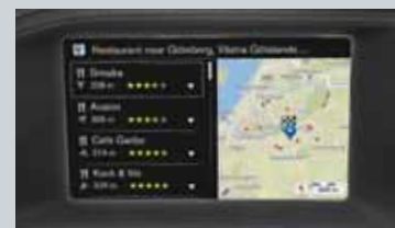
Sensus Connect et Sensus Navigation