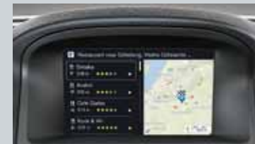
Sensus Connect et Sensus Navigation