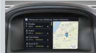
Sensus Connect et Sensus Navigation