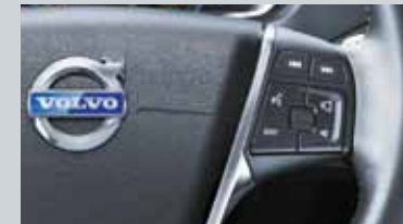
Commande vocale avancée au volant et Connexion Bluetooth®