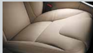
Assise et dossier des sièges en Cuir (9)