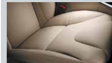
Assise et dossier des sièges en Cuir