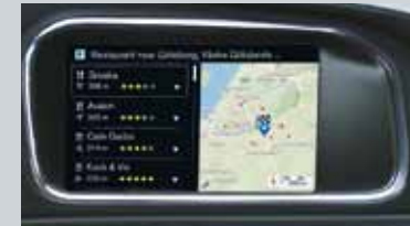
Sensus Connect et Sensus Navigation