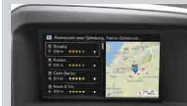
Sensus Connect et Sensus Navigation