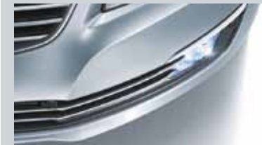
Radar de stationnement avant