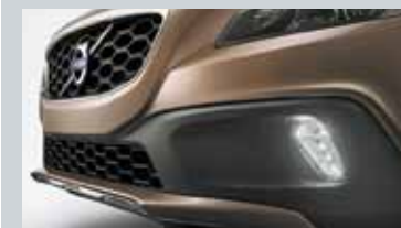
Feux de jour à LED