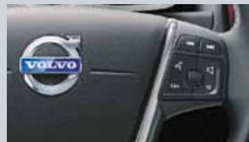
Commande vocale avancée au volant et Connexion Bluetooth®