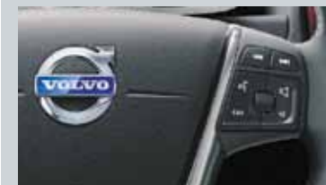
Commande vocale avancée au volant et Connexion Bluetooth®