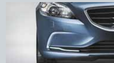
Feux de jour à LED