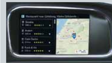
Sensus Connect et Sensus Navigation