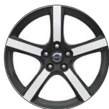
MIDIR 18" Diamant / Noir Laqué