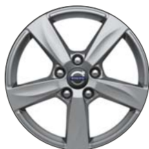
MATRES 16" Argent Mat