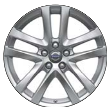
TAMESIS 18" Argent Brillant