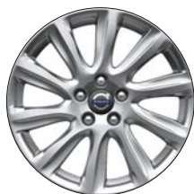
MANNAN 17" Argent