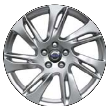
TARANIS 18" Argent Brillant