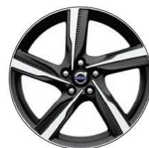
IXION II 18" Diamant / Noir Mat (R-DESIGN uniquement)