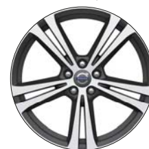
ARTIO 19" Diamant / Anthracite