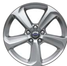
SEGOMO 17" Argent Brillant