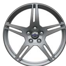
YMIR 18" Anthracite