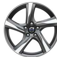
IXION 17" Diamant / Anthracite (R-DESIGN uniquement)