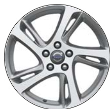
SPIDER 17" Diamant / Anthracite