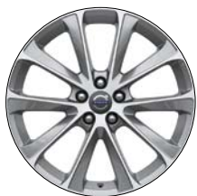
DAMARA 19" Argent/Diamant