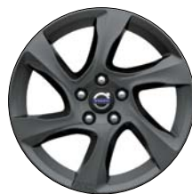
LARENTA 17" Anthracite