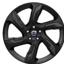
ALECTO 19" Noir Laqué/Noir Mat (disponible en accessoires)