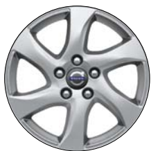
GEMINUS 16" Argent Mat