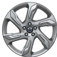
ALECTO 19" Argent/Argent Mat (disponible en accessoires)