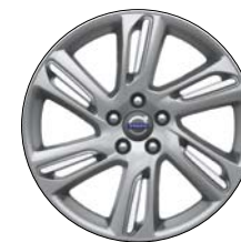
MEFITIS 18" Argent/Diamant