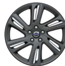
MEFITIS 18" Anthracite/Diamant