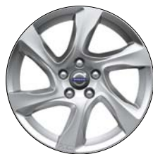
LARENTA 17" Argent