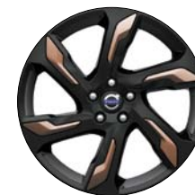
ALECTO 19" Noir Laqué/Cuivre (disponible en accessoires)