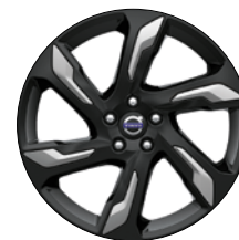
ALECTO 19" Noir Laqué/Argent Mat (disponible en accessoires)