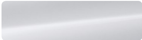
614 Blanc Glace