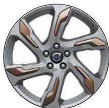
ALECTO 19" Argent/Cuivre (disponible en accessoires)