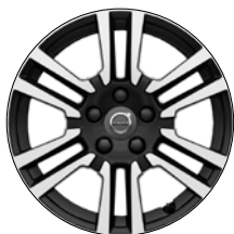
GENAM 16" Diamant/Noir Laqué