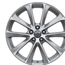
DAMARA 19" Argent/Diamant