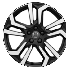
METALLAH 18" Diamant/Noir Laqué