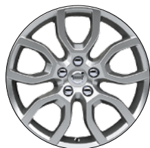
KEID 17" Argent