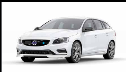
Couleur Non Métallisée 614 Blanc Glace