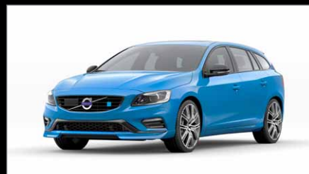
Couleur Exclusive 619 Bleu Rebelle