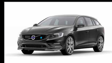
717 Noir Onyx Métallisé