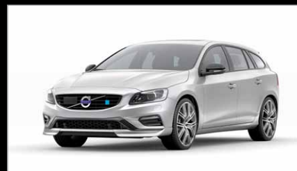
Couleurs Métallisées 711 Argent Brillant Métallisé