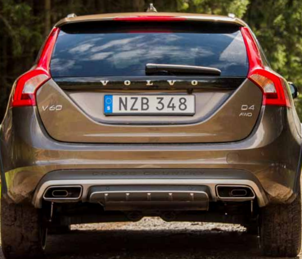
V60 CROSS COUNTRY