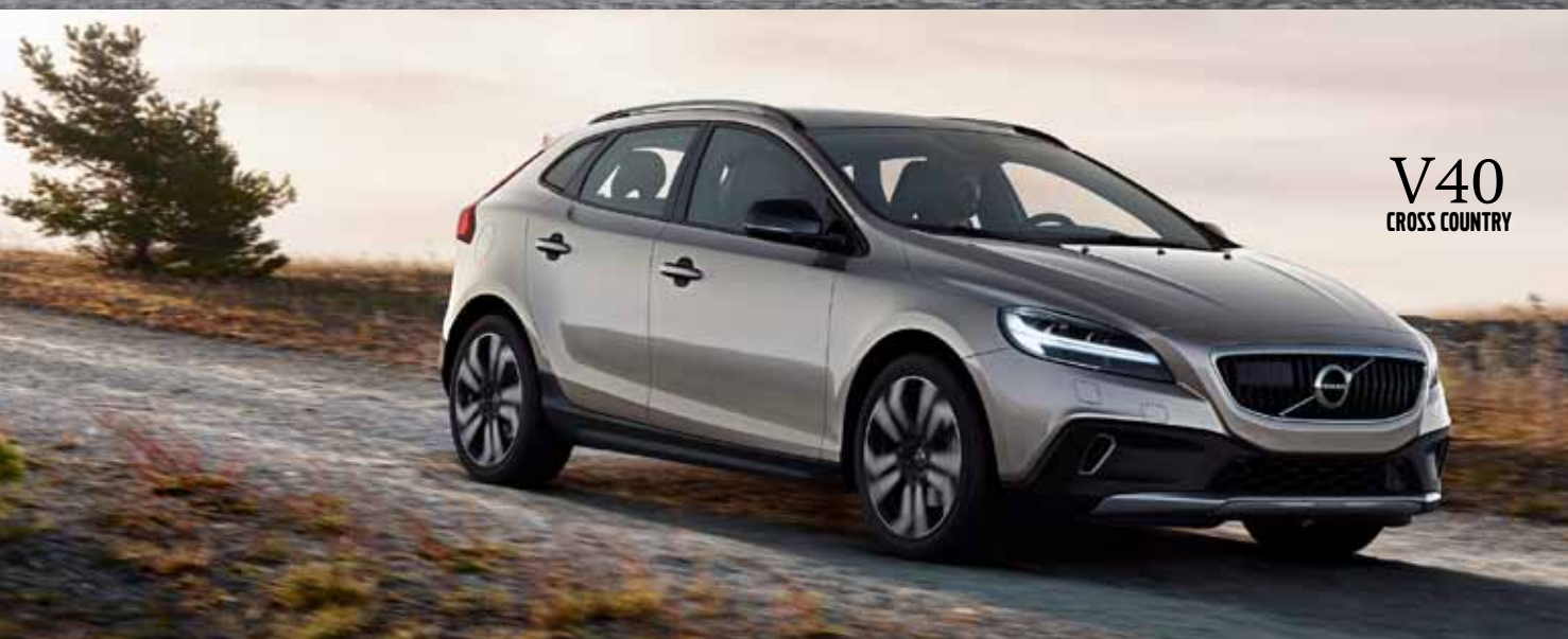
V40 CROSS COUNTRY