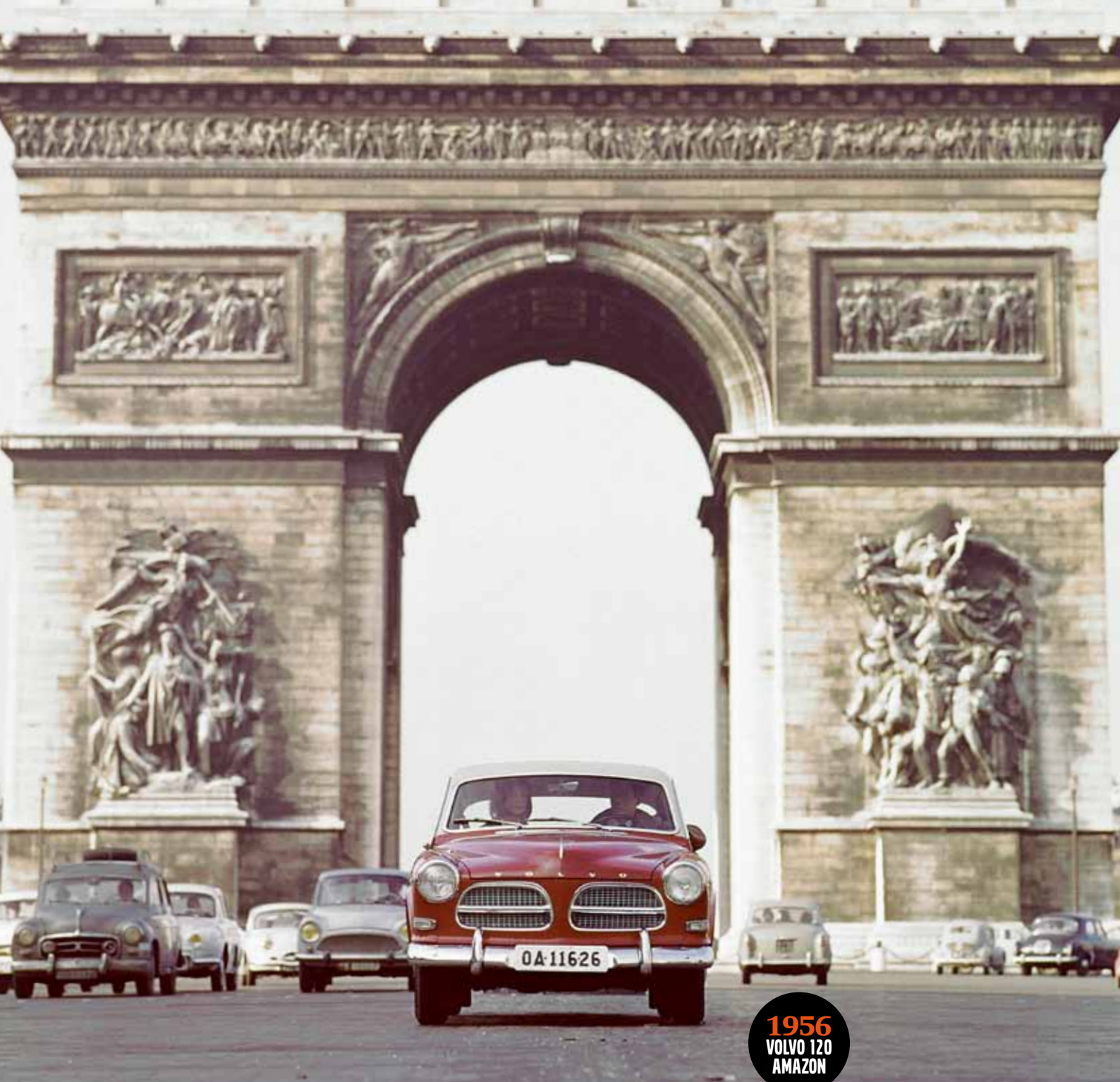
1956 VOLVO 120 AMAZON