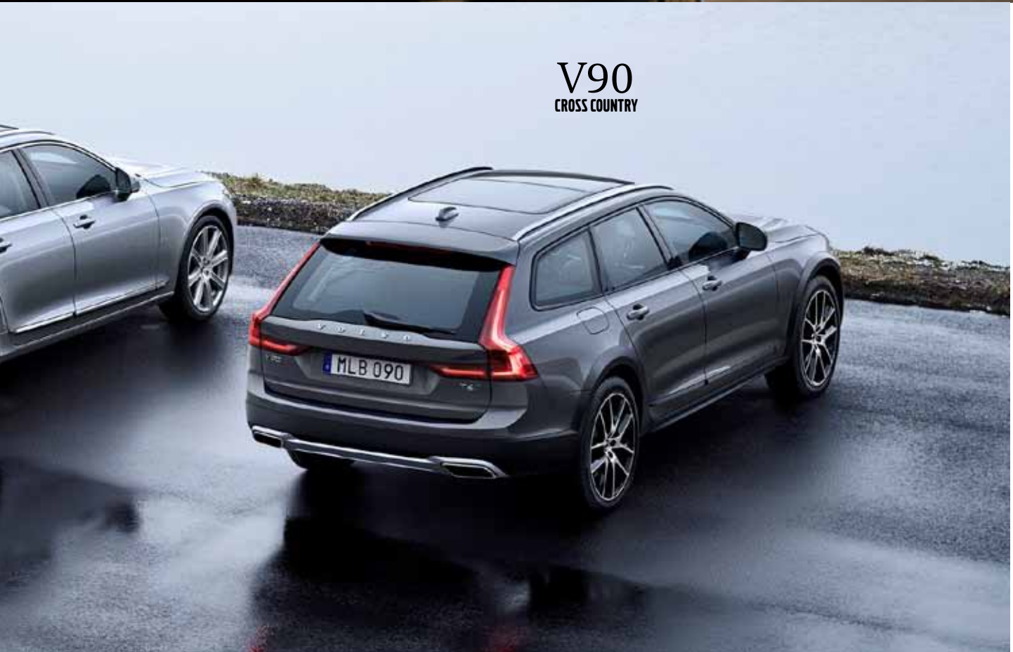
V90 CROSS COUNTRY