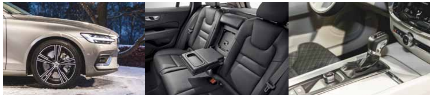
Les tarifs V60 au 21/02/2018 (en € TTC, assistance 3 ans incluse)

Enfin, le système multimédia Sensus de Volvo Cars, pleinement compatible avec Apple CarPlay, Android Auto et la 4G, permet au conducteur de rester connecté en permanence. Il est accessible par le biais d'un écran tactile intuitif, de type tablette, regroupant différentes fonctions du véhicule, la navigation, les services connectés et les applications de divertissement.