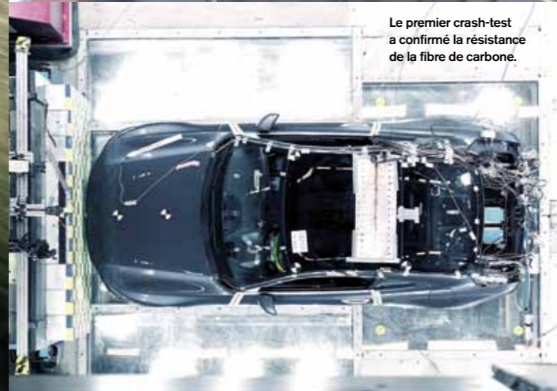
Le premier crash-test a confirmé la résistance de la fibre de carbone.