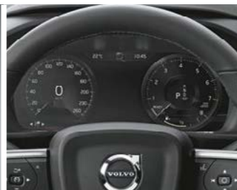
Combiné d'instrument digital 12.3"