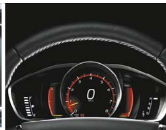
Combiné d'instruments digital