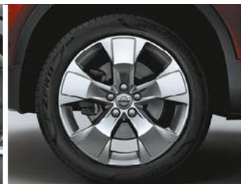
Jantes alliage 18"