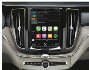
Sensus Connect et Sensus Navigation

Modèle présenté : Finition Inscription avec options