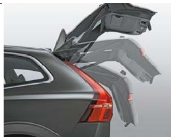
Hayon de coffre électrique