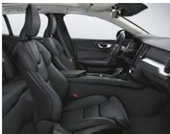
Sellerie Cuir avec Sièges confort

Modèle présenté : Finition Business avec options