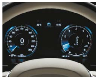
Combiné d'instruments digital