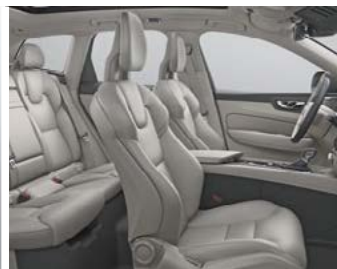
Assise et dossier des sièges en Cuir