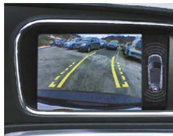
Caméra de recul

Modèle présenté : Finition Business avec options