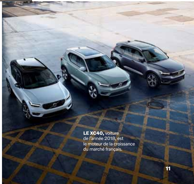
LE XC40 , voiture de l'année 2018, est le moteur de la croissance du marché français.

Effectivement, la dynamique commerciale s'est poursuivie sur le premier trimestre qui enregistre une croissance de 9,4 % des ventes mondiales par rapport à 2018. Le marché européen (+ 8,8%) est soutenu par la forte demande pour les XC40 et XC60, la Chine (+ 3,9 %) par le XC60 et la berline S90 assemblée sur place, les Etats-Unis (+ 9,8 %) par les XC60 et XC90. Sauf catastrophe, 2019 s'annonce également comme une année exceptionnelle.