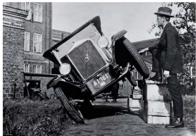
Basculera ? Basculera pas ? En 1926, le Centre de sécurité était encore rudimentaire mais il existait déjà ! Et ce prototype de la première Volvo ÖV4 commercialisée l'année suivante a dû passer l'épreuve.

Alors que la société s'oriente vers un avenir 100 % électrique, ces dernières années, le Centre de sécurité a été équipé et préparé spécialement dans le but de réaliser des crash-tests spécifiques pour ce type de véhicules.