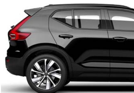
717 Noir Onyx Métallisé