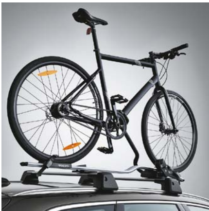
Porte-vélo sur toit en Aluminium. 115 €