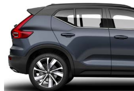
723 Bleu Denim Métallisé