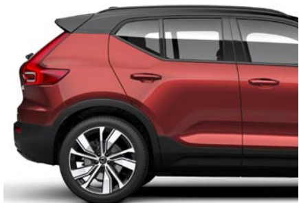
725 Rouge Fusion Métallisé