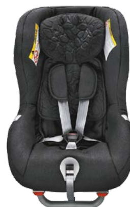
Siège enfant dos à la route (9-25 kg). 430 €