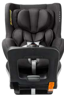
Siège enfant rotatif dos à la route i-Size (0-18 kg). 765 €