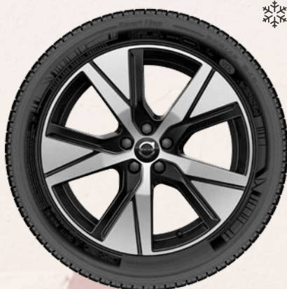
19" 5 branches Graphite Mat / Diamant (en série)