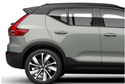
733 Vert Sauge Métallisé