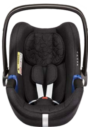
Siège bébé dos à la route (0-13 kg). 340 €

Créez un Volvo XC40 adapté à votre quotidien en choisissant des accessoires Volvo imaginés selon vous et votre voiture. Nos nouveaux sièges enfant conjuguent confort et sécurité de pointe et sont pensés pour se fondre harmonieusement dans votre Volvo. Ils sont durables et résistants, afin que votre enfant puisse voyager lui aussi en toute sécurité.