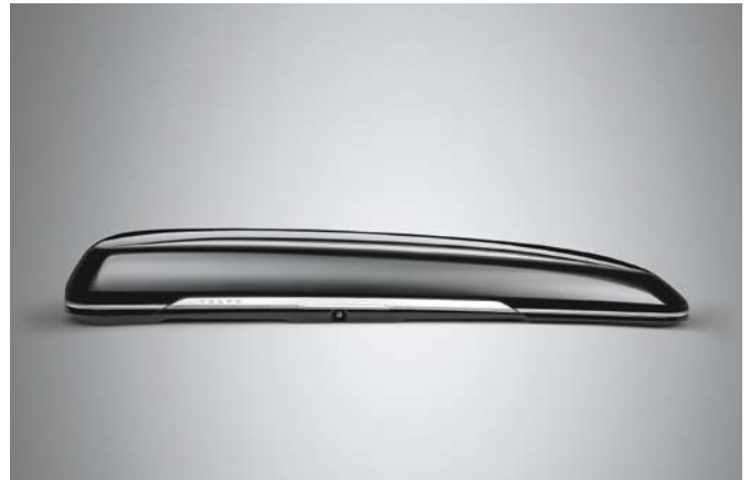
Coffre de toit conçu par Volvo Cars. Volume de 430 litres. 995 €