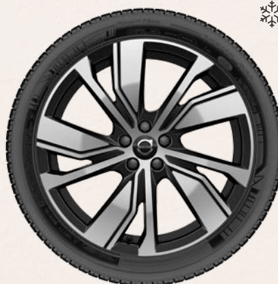
20" 5 branches double en V Graphite Mat / Diamant (en option)