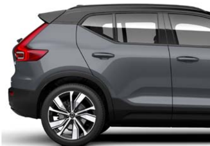
728 Gris Tonnerre Métallisé