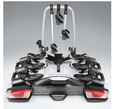
Porte-vélos sur crochet d'attelage. Permet de transporter jusqu'à trois vélos sur le crochet d'attelage. 690 €