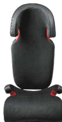
Rehausseur et dossier pour enfant en Cuir/Tissu façon nubuck (15-36 kg). 295 €