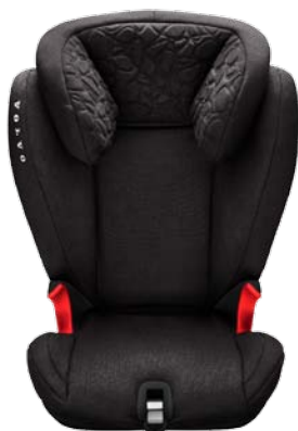
Rehausseur avec appuie-tête réglable (15-36 kg). 305 €