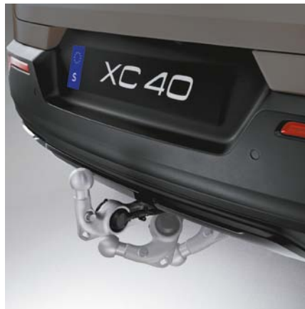
Crochet d'attelage amovible semi-électrique 13 broches. Charge max. 80 kg. Poids remorquable max. 1500 kg. 1165 €