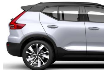
729 Gris Glacier Métallisé