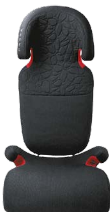
Rehausseur et dossier pour enfant en laine (15-36 kg). 205 €