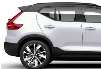
707 Blanc Cristal Métallisé