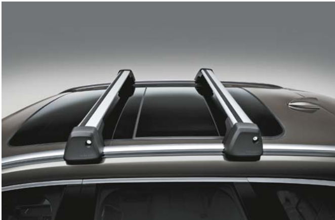
Barres de toit en Aluminium. 200 €

Pour vous permettre de trouver la meilleure solution à vos besoins, quand vous en avez besoin, nous avons créé une gamme d'accessoires de chargement extérieur sur mesure, parfaitement assortis au design du XC40 et à vos envies d'évasion. Fabriqués dans des matériaux robustes et durables, ils résistent aux impitoyables hivers suédois et à une utilisation intensive pour vous accompagner partout.