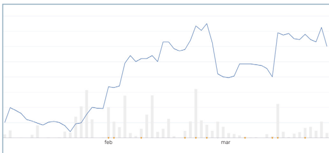
Aktiekursens förändring under Q1 2026