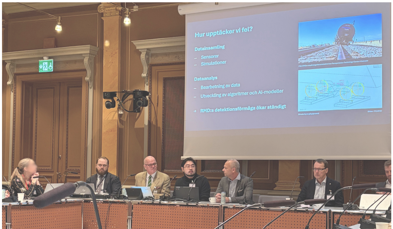
Seminarium i Riksdagen

Bolaget har under perioden januari-mars 2026 aktiverat utvecklingskostnader om 2 552 (2 342) TSEK.