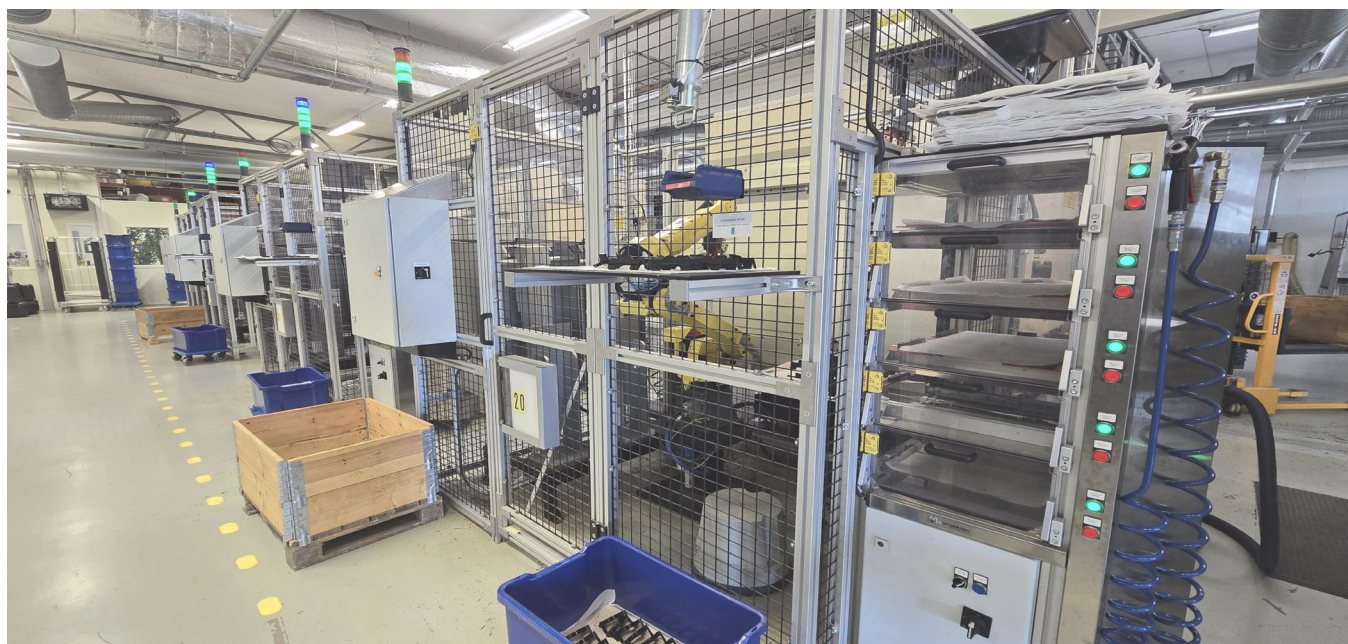
Den robotstyrda fräsmaskinen hos Brodit AB som tillverkar höljet till våra kameror och PMU:er, samt metalldelar till PMUC:n.