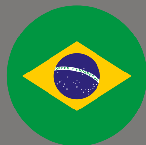
Brasilien Rang 5