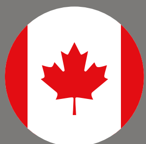
Kanada Rang 3