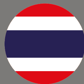
Thailand Rang 4