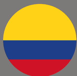
Kolumbien Rang 2