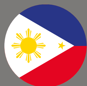
Philippinen Rang 1

Als Führungskräfte, Unternehmerinnen und Arbeitnehmerinnen