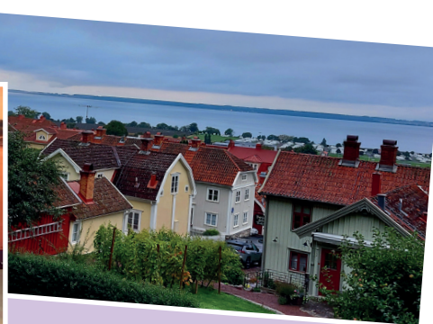
Camillas egna ljuvliga bilder från Gränna vid Vätterns strand.