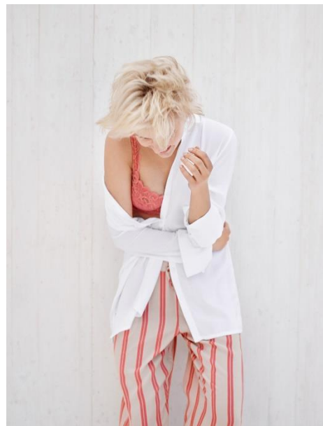
MOMENTS | SOUTIEN-GORGE 07 1467 FAVOURITES | CHEMISE ML 07 8521 SLEEP & LOUNGE | PANTALON 07 7617