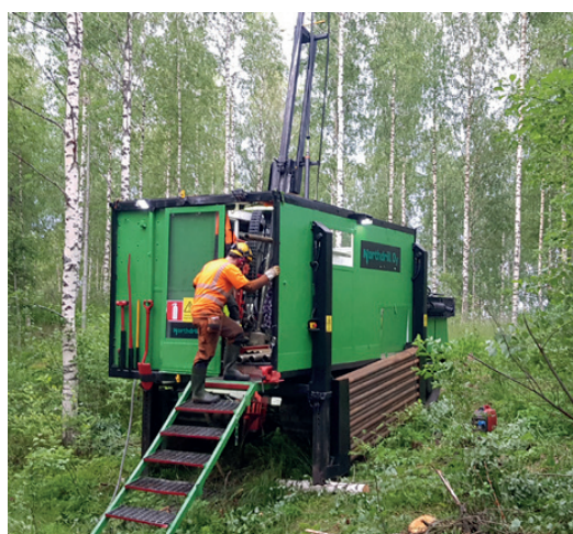
Borrhningar påbörjas i Hautalampi-projektet, Finland