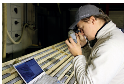
Analyser bekräftar en fortsättning på mineralresursen i Hautalampi-projektet