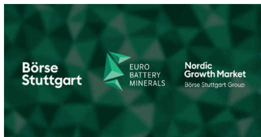
Eurobattery Minerals expanderar till Tyskland via parallellnotering