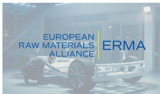
Eurobattery Minerals är en del av European Raw Materials Alliance (ERMA)