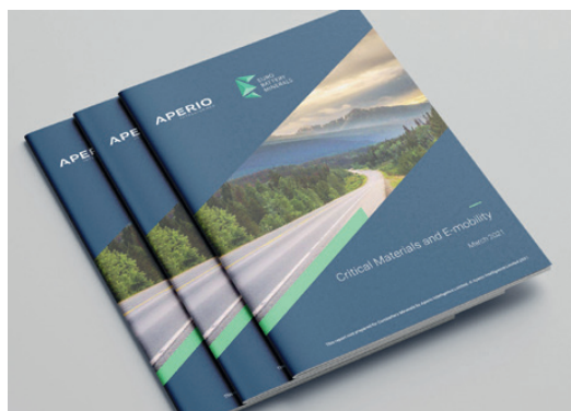
Eurobattery Minerals presenterar rapport om råvaruförsörjning för elfordon