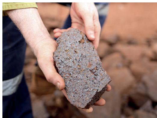
Nytt undersökningstillstånd reserverat i Finland