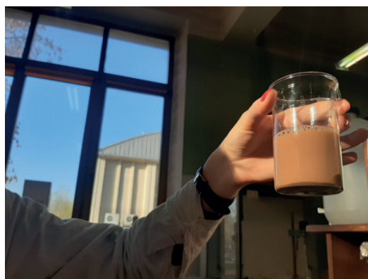
Forskningsprojekt om vanadin i Eurobattery Minerals fyndighet i Fetsjön går in i nästa fas