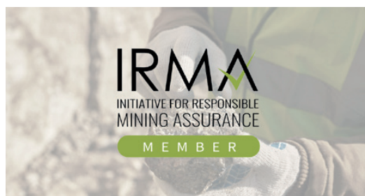
Eurobattery Minerals blir medlem i Initiative for Responsible Mining Assurance (IRMA)