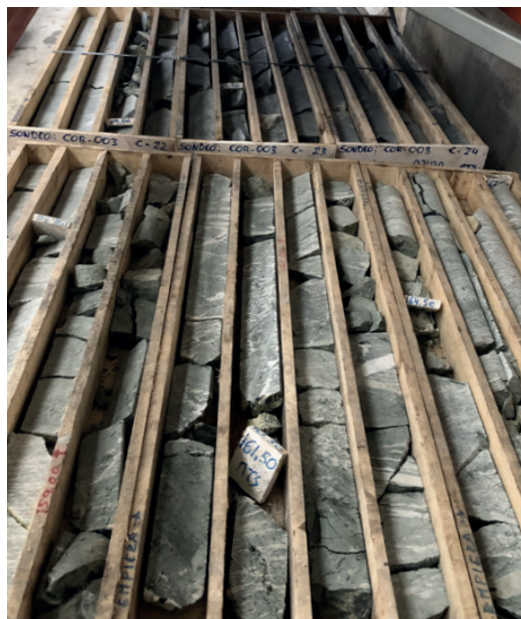
Slutresultat från borrhningar visar en större mineraliserad zon än förväntat i Castriz