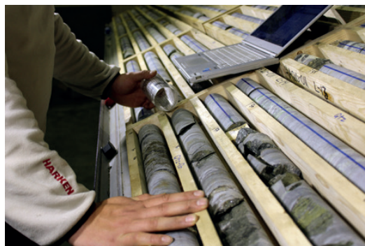
Uppgradering av mineralresursen i Hautalampi