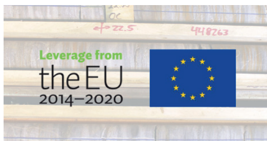
Hautalampi-projektet i Finland beviljas 6,4 MSEK i utvecklingsstöd