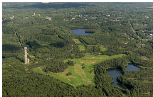
Eurobattery Minerals tecknar investeringsavtal med option att förvärva Hautalampi nickel-kobolt-koppargruva