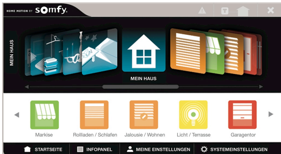
Bild 2: Hausautomation mit TaHoma Connect: Flexibel und einfach zu erweitern.