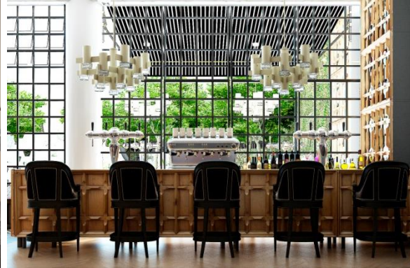
H10 Rambla Catalunya (Barcelona)

In diesem Jahr plant H10 Hotels die Eröffnung von zwei weiteren 4-Sterne Superior Hotels in Barcelona : das H10 Art Gallery und das H10 Rambla Catalunya. Beide Hotels verfügen über eine Terrasse mit Plunge Pool sowie einen ruhigen Garten, wo sich die Gäste entspannen und wie zu Hause fühlen können. Moderne Tagungsräume und kostenfreies W-LAN im gesamten Hotel runden das Angebot ab. Mit der Eröffnung dieser beiden neuen Häuser stärkt H10 Hotels seine Präsenz in der Hauptstadt Kataloniens weiter und erhöht das Portfolio in Barcelona auf insgesamt 11 Hotels.