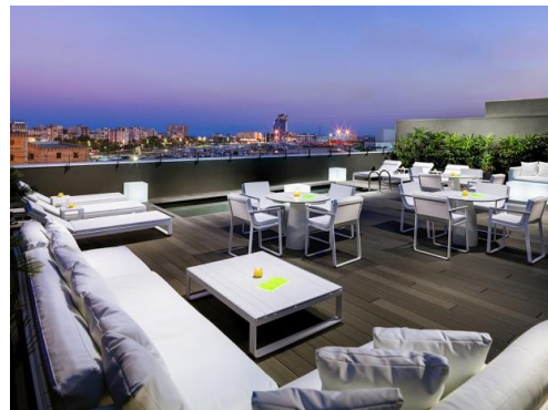
H10 Port Vell (Barcelona)

DESTINATIONEN: Teneriffa · Lanzarote · Fuerteventura · La Palma · Gran Canaria · Mallorca · Costa del Sol · Costa Dorada · Riviera Maya · Punta Cana · Kuba · Barcelona · Madrid · Rom · London · Berlin