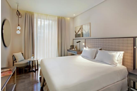
H10 Art Gallery (Barcelona)