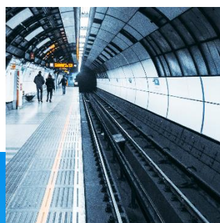
Rail & Transportation