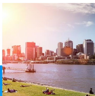
Smart & Safe Cities