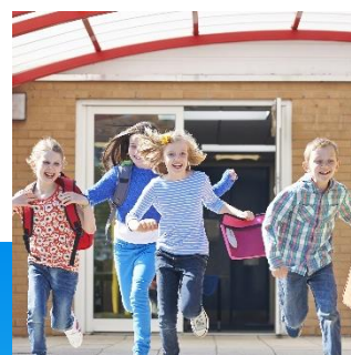
Education & Public