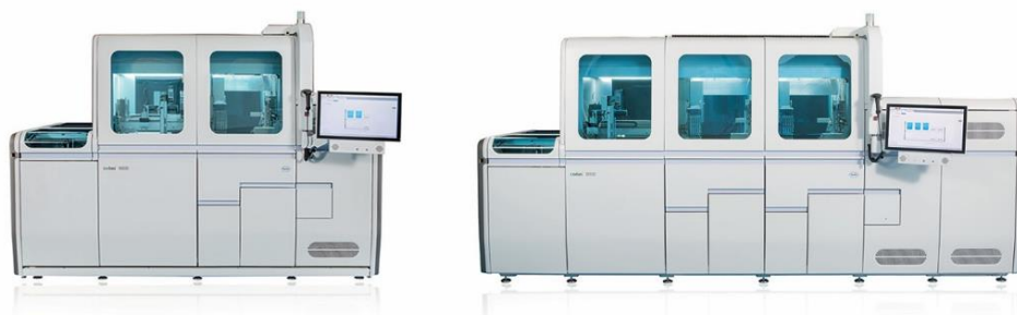
Bild 2. cobas 6800 (till vänster i bild) och cobas 8800 (till höger i bild).

Sjukhus- och referenslaboratorier kan utföra testet på Roches helautomatiserade cobas 6800 och cobas 8800-system. Testet kan köras samtidigt med andra analyser från Roche på dessa system. System av typen cobas 6800 finns idag i några regioner i Sverige.