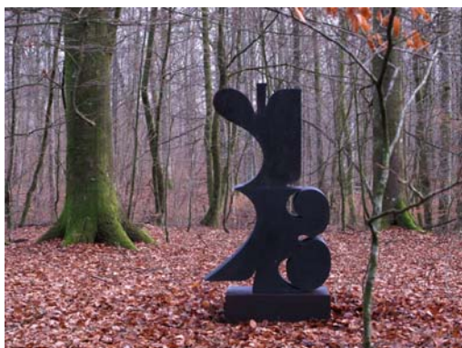
Interlettre av Carl Fredrik Reuterswärd.