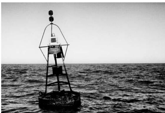
Graf Spee av Jan Håfström, Juan Pedro Fabra Guemberena och Michael von Hausswolff.