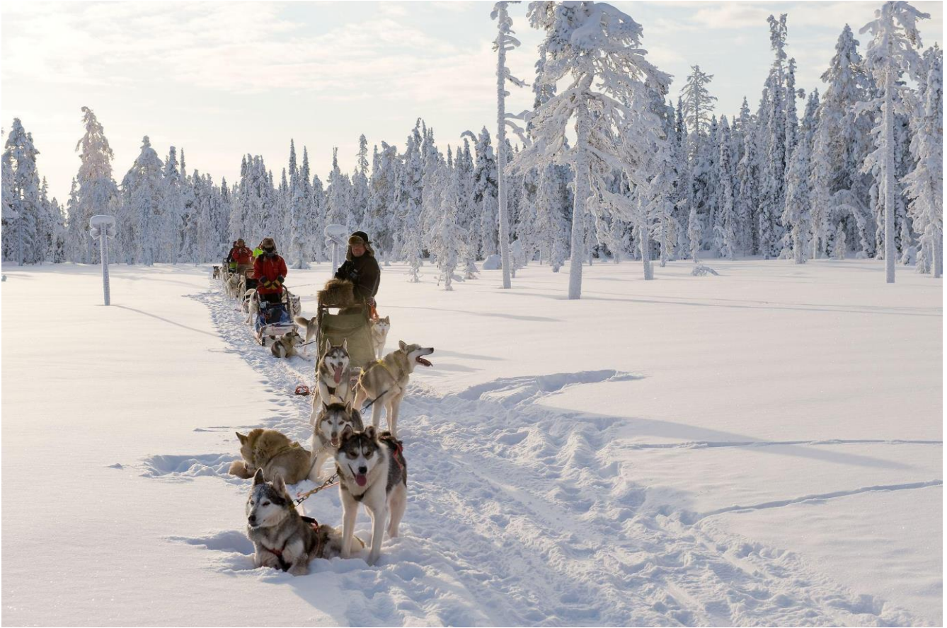
Muoniossa voi nauttia puhtaasta ilmasta esimerkiksi koiravaljakon kyydissä.

Maailman terveysjärjestö WHO lähetti tämän vuoden toukokuussa hyviä uutisia kotimaahamme, kun se julisti, että maailman puhtain ilma löytyy Suomesta. WHO:n mukaan Suomen ilmanlaatu päihittää puhtaudellaan kaikki muut maat. Maailman raikkainta ilmaa pääsee hengittämään Muoniossa, Suomen Lapissa – tässä yksi syy lisää suunnata ihaillemaan pohjoisen upeita tunturimaisemia.