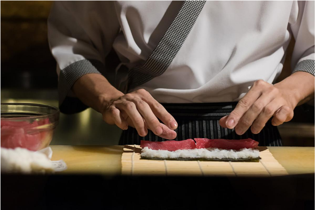
Sushiravintola Tokiossa. *

Kyllä, on olemassa sellainenkin tilasto. Kaikkein eniten ravintoloita kaupungin asukaslukuun suhteutettuna löytyy Tokiosta, Japanista. Siellä nälkäisiä arjen sankareita ruokkii yhteensä 1 122 ravintolaa 100 000 asukasta kohden, eli yksi ravintola noin 90 asukasta kohden. Ravintoloiden määrä Tokiossa on yli kolminkertainen Roomaan verrattuna, yli kymmenkertainen Intian suurkaupunki Mumbaihin verrattuna, ja 143-kertainen Istanbuliin verrattuna, jossa sijaitsee mukaan vain 7,8 ravintolaa 100 000 asukasta kohden. Tiedot on saatu World Cities Culture Forum in tekemästä selvityksestä perustuen paikallisten tilastokeskusten tietoihin. Kaupunkikohtaiset tiedot on kerätty vuosien 2012 ja 2015 välillä.