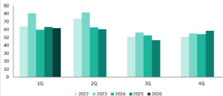
Nettoomsättning per kvartal (MSEK)