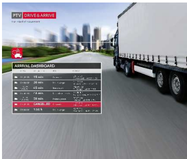
Dynamisches Transport Management mit dem Arrival Board von PTV Drive&Arrive.