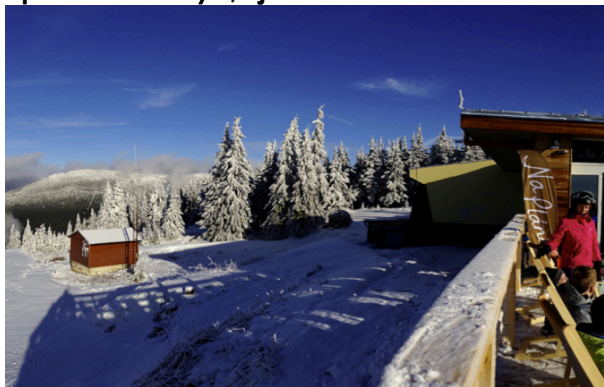
Spindleruv Mlyn erbjuder både fantastisk natur och ölbad.