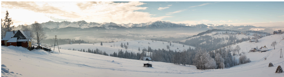
Mycket åkning för pengarna i öst.

Skidsemestern kan snabbt bli en dyr affär men momondo har listat de sju bästa resmålen där vistelsen inte behöver bränna hål i plånboken. Förutom bra skidåkning erbjuder Östeuropa bättre priser på liftkort, skidhyra, mat och dryck än de klassiska alporterna. Dessutom går det att fynda flygresor hit.