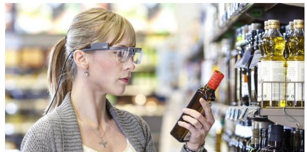
Tobii Pros eyetracking-glasögon erbjuder en unik möjlighet att studera beteende på ett objektivt sätt i många olika miljöer.