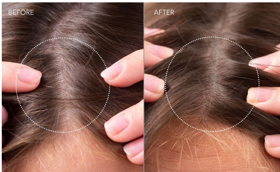
Kuvassa: LED-terapiahoitot ennen ja jälkeen.

Kliiniset tutkimukset ovat osoittaneet, että LED-valohoidolla on merkittävä ja myönteinen vaikutus hiustenkasvuun, sillä se parantaa hiusten tiheyttä ja pidentää hiuksen kasvuvaihetta (anageenivaihetta). Punainen LED-valo stimuloi karvatuppia ja edistää paksumpien hiusten tuotantoa, auttaen siten vähentämään hiustenlähtöä. T-Sonic-hieronta tarjoaa lisäksi lempeän käsittelyn, joka stimuloi hiuspohjan verenkiertoa. Se varmistaa, että hapot ja tärkeät ravintoaineet pääsevät syvälle ihoon ja ravitsevat karvatuppia tehokkaasti. Näin se tukee elpymistä ja edistää tervettä hiustenkasvua.