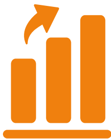
Marknadsetablering: 3 år

Från kommersiell lansering är Bolagets bedömning att det tar cirka tre år för marknadsetablering och för att penetrera marknaden till 10%, vilket är Bolagets målsättning. Utvecklingen av banbrytande medicinteknik är kostnads- och tidskrävande på grund av de regulatoriska processerna, men när produkten väl når marknad beräknas Bolaget få lönsamhet snabbt.