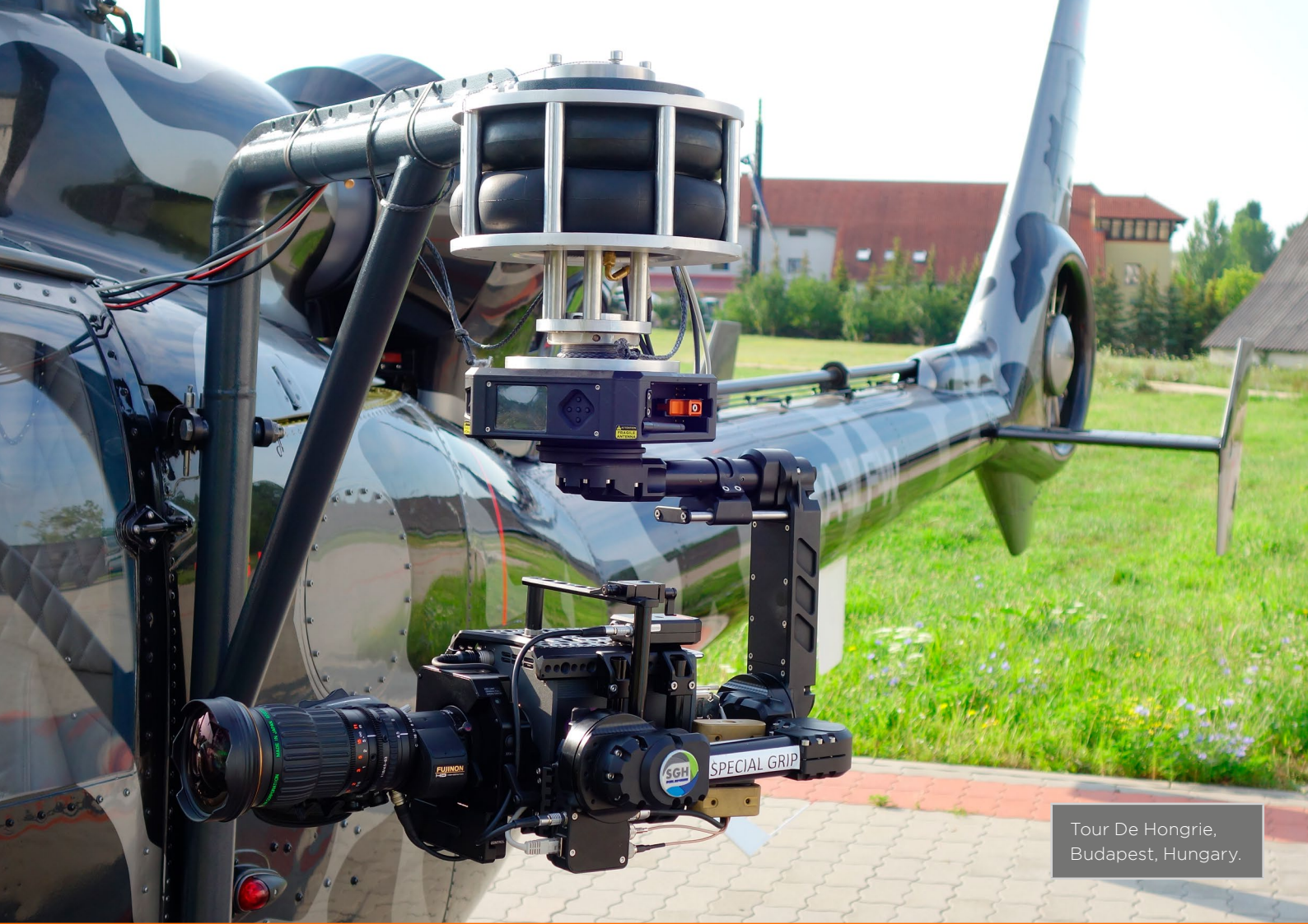
Tour De Hongrie, Budapest, Hungary.