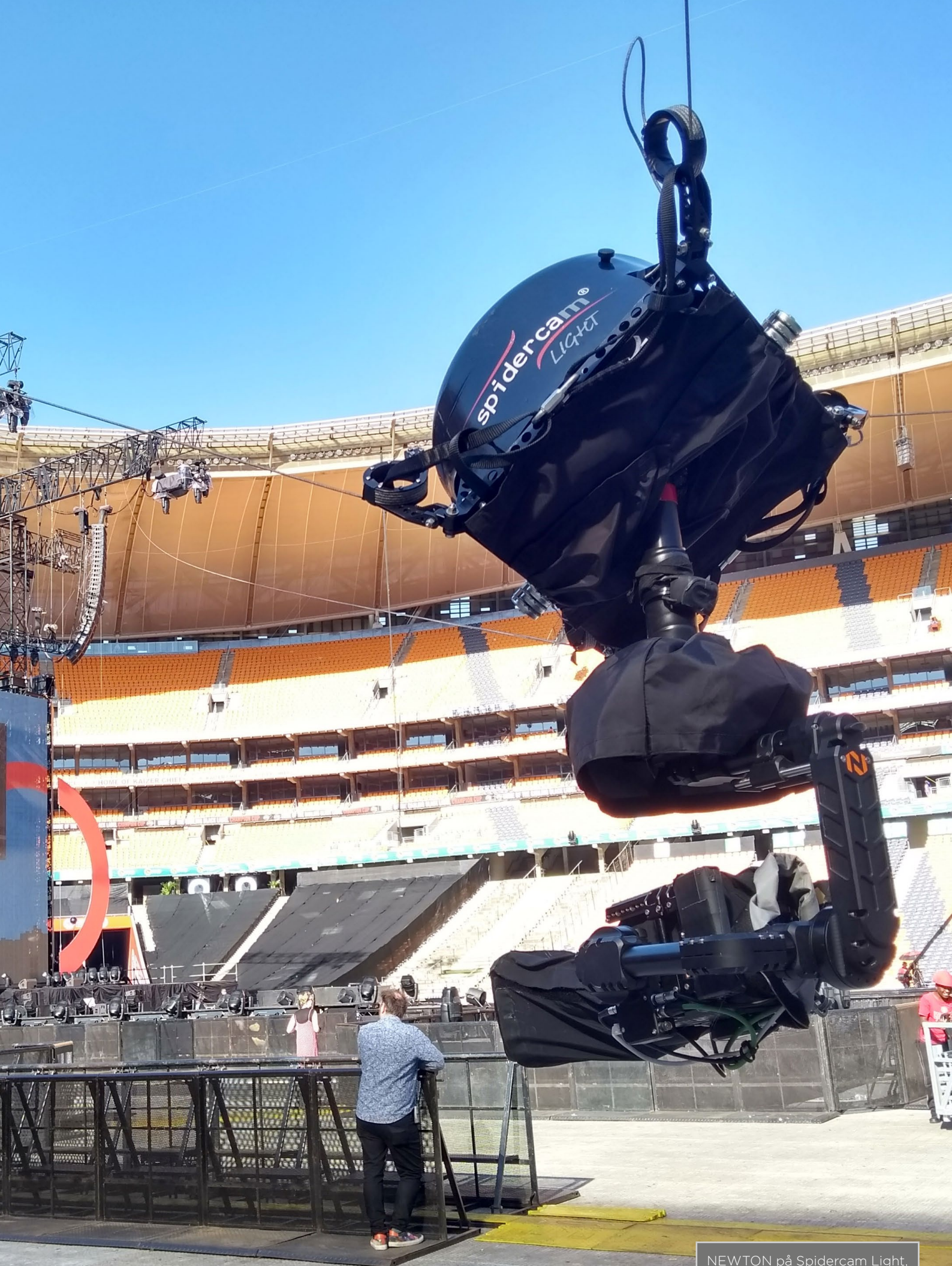
NEWTON på Spidercam Light, Global Citizen Festival, Johannesburg, Sydafrika.