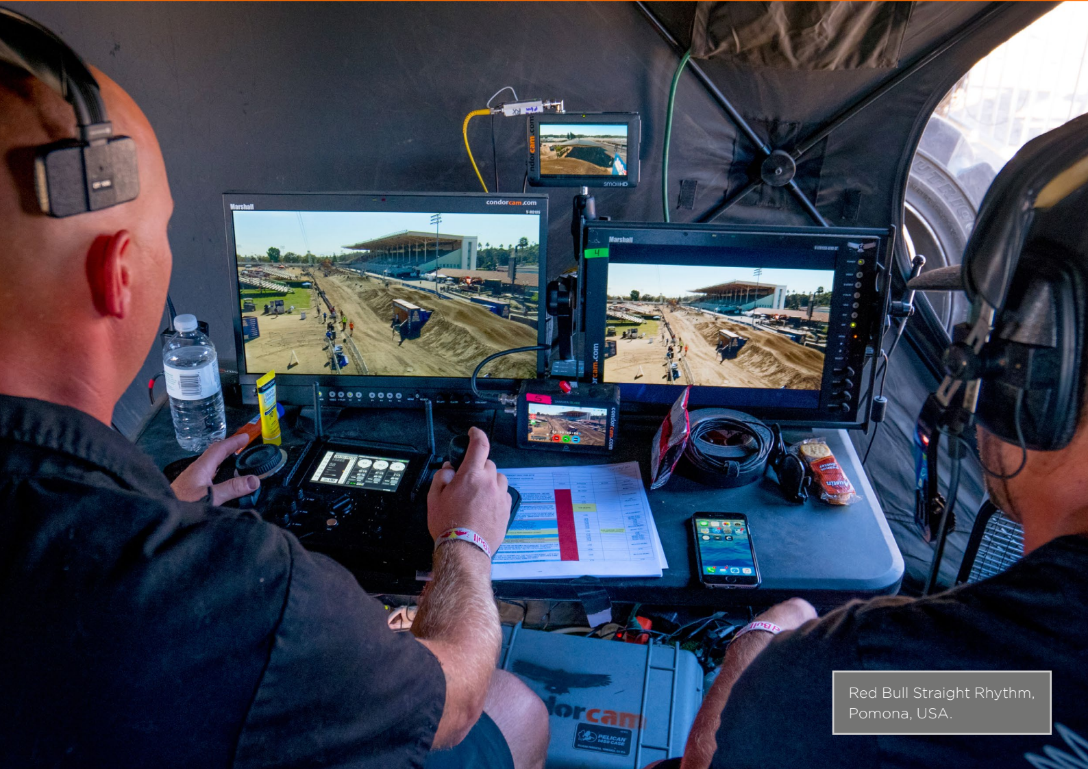
Red Bull Straight Rhythm, Pomona, USA.