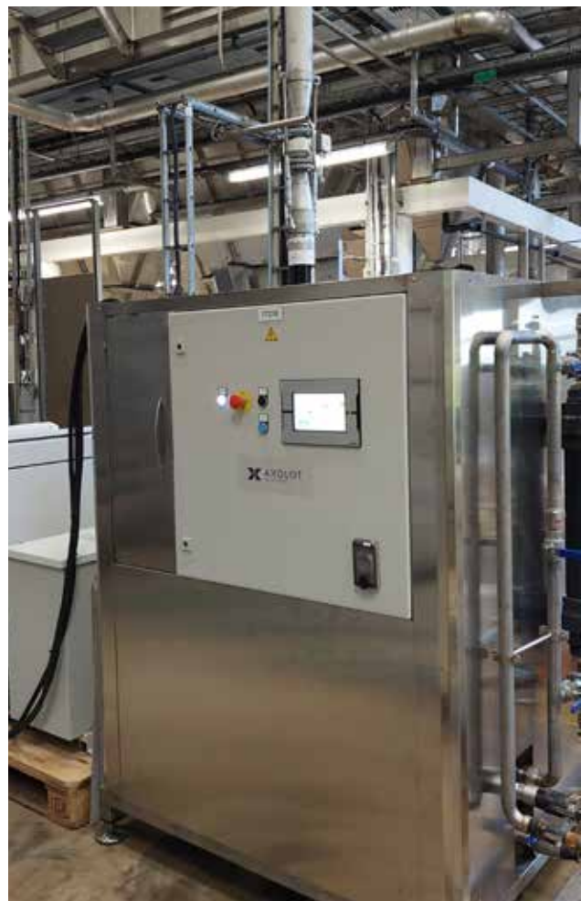
AxoPur demoanläggning i drift.