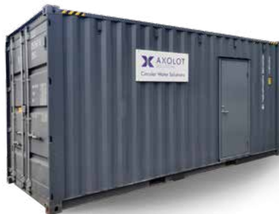
Standardanläggningar säljs i form av nyckelfärdiga system, som kan monteras i containers.

I takt med att vi ökar vår försäljning av anläggningar så blir vår leveransförmåga naturligtvis satt på prov. Vi har etablerat ett utmärkt samarbete med några utvalda underleverantörer och verkstäder, vilket innebär att vår leveranskapacitet snabbt kan skalas upp i takt med att antalet sålda enheter ökar. Vidare så innebär det faktum att vi nu börjat samarbeta med andra teknikleverantörer att vi även breddar vårt produktutbudande i syfte att i ännu högre grad kunna erbjuda helhetslösningar. Det finns en bred insikt inom branschen att nya och effektiva helhetslösningar kräver ett proaktivt samarbete i nätverk. För vår del är ett konkret exempel det samarbete som inleddes med Fortum Waste Solutions under 2022 där vi under det senaste kvartalet bedrivit flera gemensamma aktiviteter.