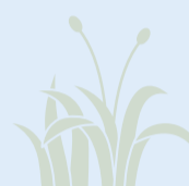
Pollens de graminées