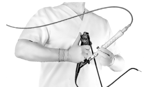
EndoDrill® URO för urinblåsecancer.

BiBB har ett pågående studieprogram utanför EUS-området, pilotstudie EDUX02, som avser vävnadsprovtagning med EndoDrill® i standardendoskop vid muskelinvasiv urinblåsecancer (MIBC), d v s tumörer som vuxit genom urinblåsans slemhinna och muskel. En inledande säkerhetsstudie om 10 patienter slutfördes i juli 2022 och resultaten ska publiceras i vetenskaplig tidskrift under 2023.