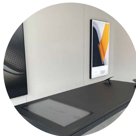
Bild från TopRights installation av Polestars showroom i Rom

Beslutet att växa och satsa inom TopSolutions och TopEnvironment, där TopRight har stor framgång mot kund och inte minst en bra lönsamhet, gör att koncernen efter omställningen beräknas stå stadigt. Tillväxt i prioriterade områden ska fortfarande ske både organiskt och genom strategiska förvärv.