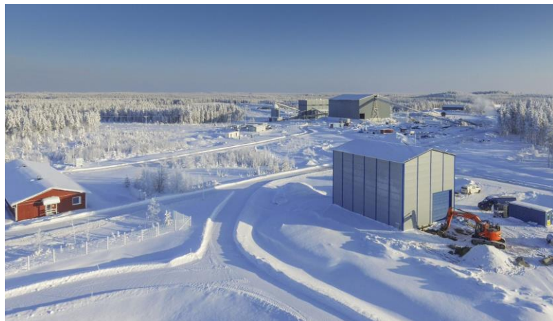
Översiktsbild över delar av gruvområdet med kontor, vattenreningsverk, malmlagerbyggnad och anrikningsverk