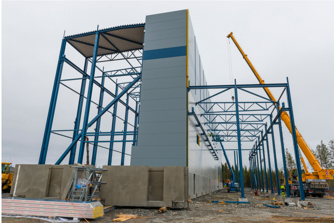
Byggnation av anrikningsverket